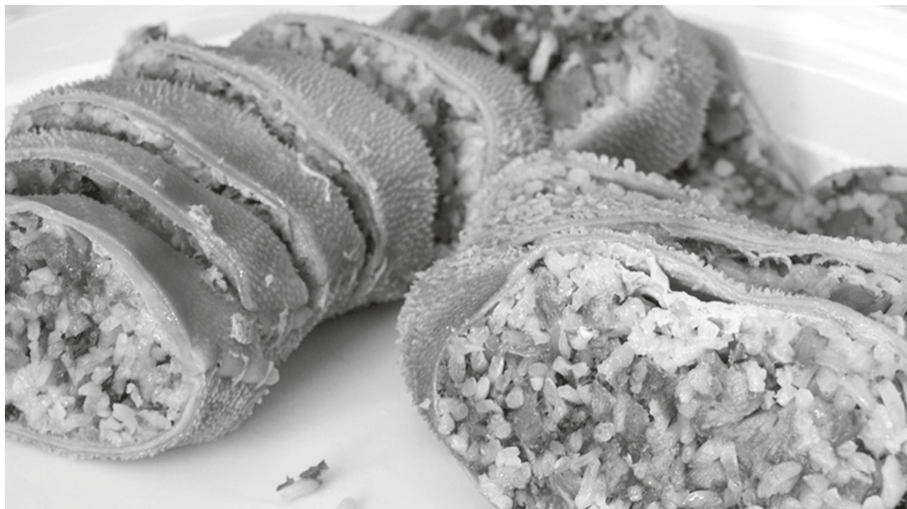
Maranho e bucho em destaque nos restaurantes da Sertã este mês

A campanha de degustação grátis de maranho e bucho decorre aos fins de semana, em 12 restaurantes do concelho da Sertã e oferece ainda descontos directos na compra destes dois produtos