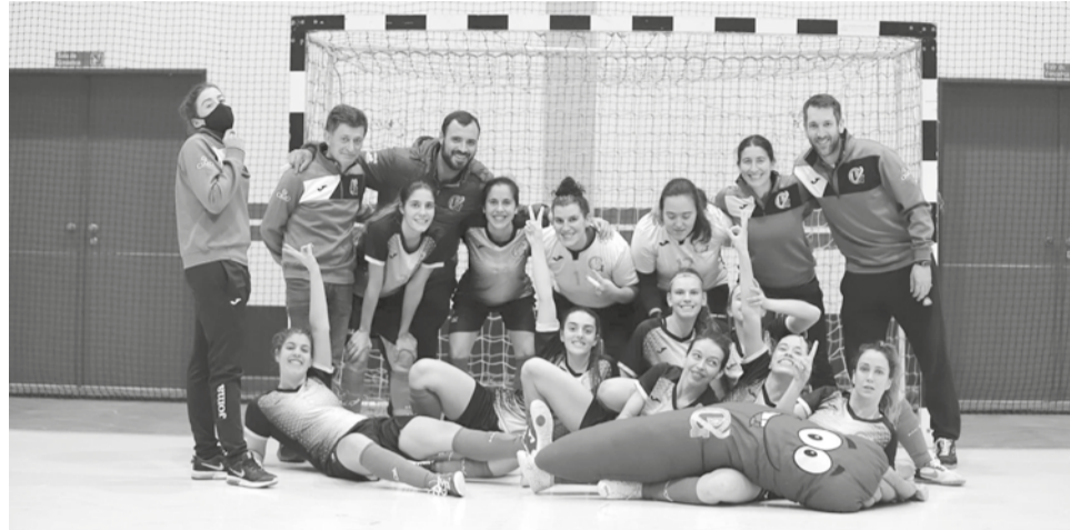
O plantel do Valverde, que este ano foi alvo de uma profunda reestruturação, recebeu no sábado, 5, as medalhas de campeão

Depois de na temporada 2018-2019 ter disputado o principal escalão do futsal feminino nacional, no ano passado a equipa do concelho do Fundão esteve próximo de ascender à II Divisão e esta época as associações de futebol de Castelo Branco e de Santarém uniram esforços para organizar um campeonato