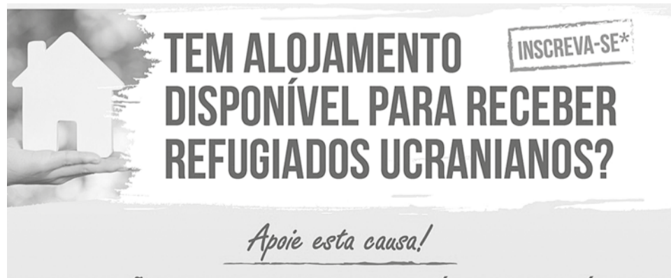
Autarquia promove campanha para disponibilização de alojamento

Posteriormente, a efectiva disponibilização de