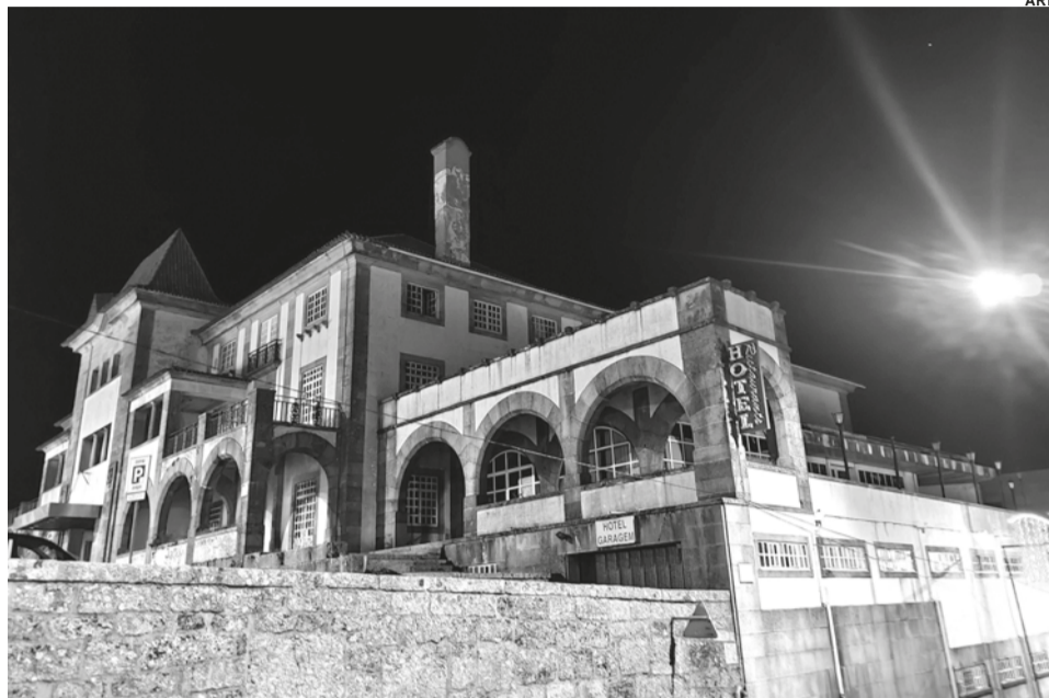
Concurso previa exploração por 50 anos do emblemático edifício