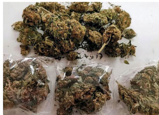
GNR aprendeu 11 doses de canábis e nove de haxixe

“Na sequência de uma operação de prevenção e combate à criminalidade, os militares da Guarda abordaram um veículo tendo o seu condutor, no momento da fiscalização, adotado um comportamento suspeito. No seguimento da acção, foram detetadas 11 doses de canábis e nove de haxixe, previamente divididas e acondicionadas em em-