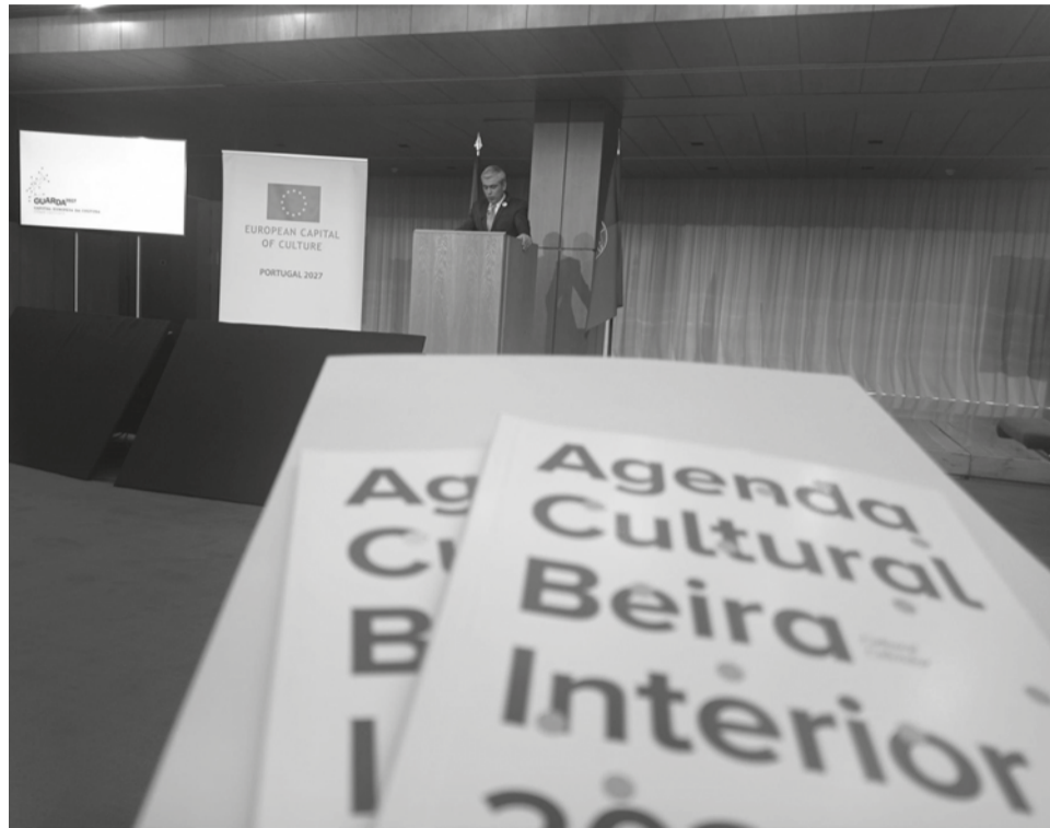
Candidatura da Guarda foi apresentada em audiência no Centro Cultural de Belém, na passada quarta-feira, 9, mas não foi uma das escolhidas pelo júri

O anúncio das cidades finalistas foi feito em conferência de imprensa no Centro Cultural de Belém, em Lisboa, no culminar de uma semana de audiências com as delegações de cada cidade candidata. As candidaturas foram avaliadas