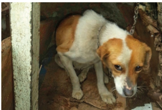
Cães estavam subnutridos, acorrentados e sem condições de higiene

A GNR resgatou quatro cães que estavam acorrentados na via pública e identificou uma mulher, de 46 anos, pelo crime de maus-tratos a animais de companhia, no concelho da Covilhã.