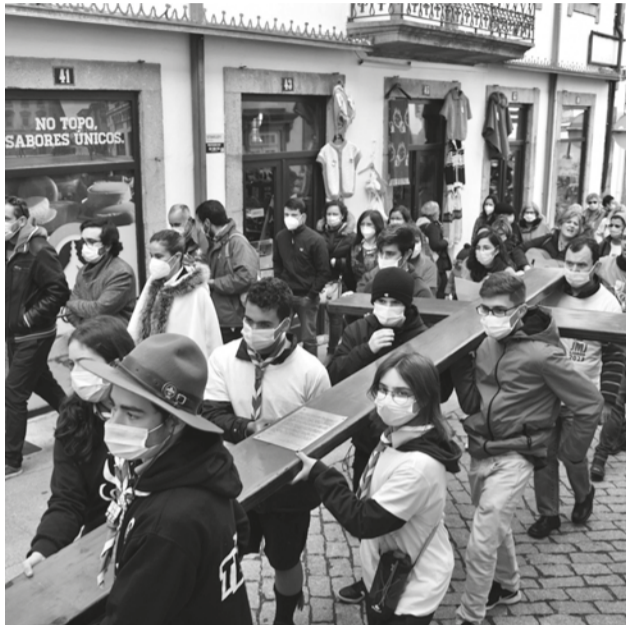
Jovens recebem símbolos esta quinta-feira na Covilhã

Após a festa de acolhimento, que se fará junto à igreja de N a Sr a de Fátima, os símbolos enviados por João Paulo II a percorrer o mundo inteiro, estarão naquela Igreja até às 21h00 para a adoração e oração pessoal. A essa hora, caso as condições climatéricas o permitam percorreram a Av. Marquês de Ávila e