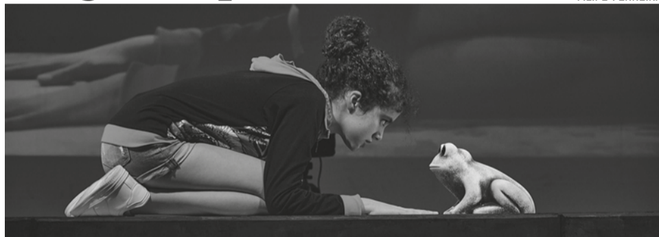
Peça fala sobre os sapos de loiça que muitas vezes são expostos em estabelecimentos comerciais para afastar ciganos

“Engolir sapos”, pela companhia Amarelo Silvestre. É esta a proposta do Teatro Municipal da Covilhã (TMC) para o próximo sábado, 19, pelas 16 horas.