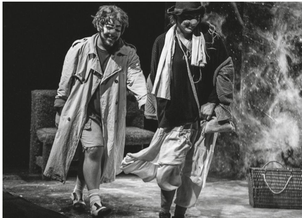
A Bruxa Teatro de Évora, que pela primeira vez participa no festival, sobe ao palco dia 26 com a peça “A curiosidade dos anjos”

Durante dez dias são nove os espetáculos, por oito companhias, de Portugal e Espanha, amadoras e profissionais, que pode ver, havendo ainda um dia inteiramente dedicado ao cinema que se faz na UBI, num ciclo orçamentado em cerca de 25 mil euros e em que as receitas angariadas (cada espectador dá o que quer, sendo desafiado a levar produtos) serão destinadas à ajuda humanitária na Ucrânia. “Face à actual situação, é nossa missão também intervir”