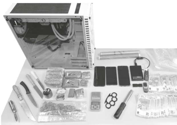
PSP apreendeu droga, uma soqueira, um bastão extensível e dinheiro, entre outros artigos

Os detidos foram presentes à Autoridade Judiciária.