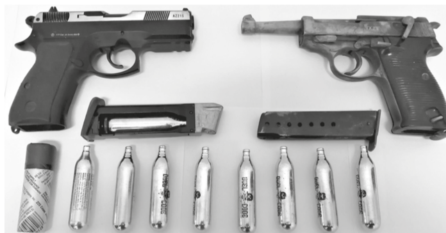
As buscas resultaram na apreensão de uma pistola calibre 7,65 milímetros e outra pistola de gás comprimido de calibre 4,5 milímetros

Após as diligências policiais, o suspeito foi constituído arguido, e os factos remetidos para o Tribunal Judicial do Fundão.