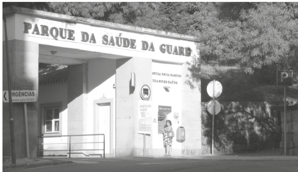
A empreitada de requalificação do edifício 5 do Hospital Sousa Martins para instalação do Departamento da Criança e da Mulher (DCM) foi adjudicada pelo valor de 7,8 milhões de euros

“Tendo sido identificada, pela Unidade Local de Saúde da Guarda, E.P.E., a necessidade de executar obras de requalificação do edifício 5 do Hospital Sousa Martins para instalação do Departamento da Criança e da Mulher, e considerando que se prevê que a empreitada se prolongue até 2023, gerando assim encargos em mais de um ano económico, procedeu-se à respectiva autoriza-