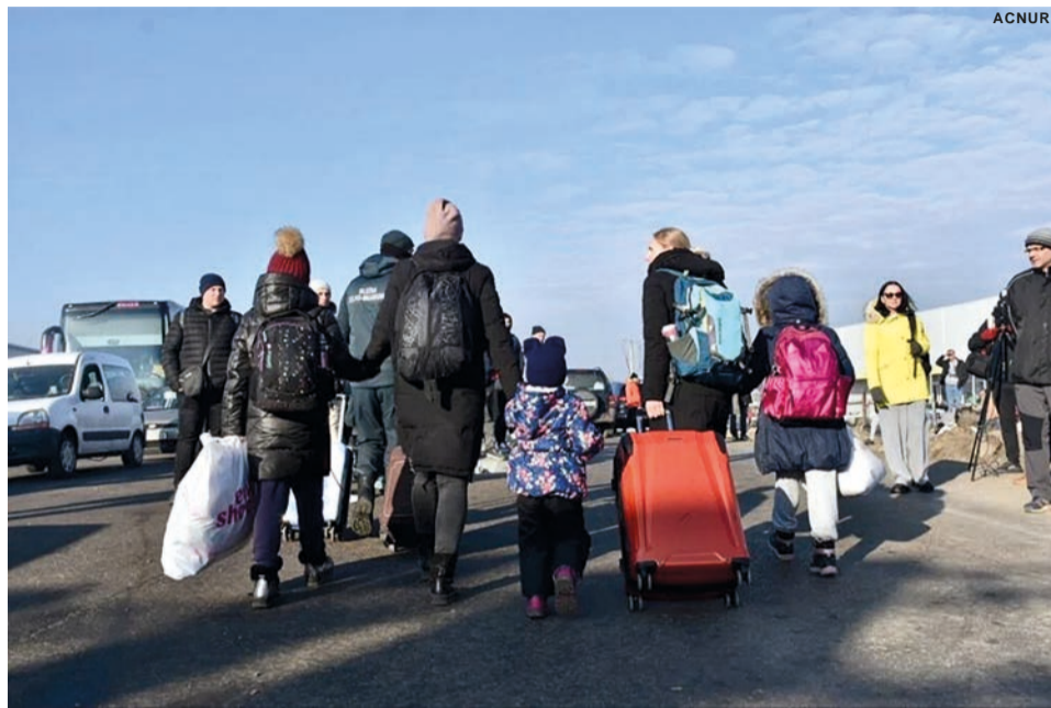
Concelho tem 145 camas disponíveis e 113 ofertas de emprego para deslocados da Ucrânia

O protocolo entre a Câmara da Covilhã e a Congregação do Verbo Divino foi reconvertido para que o Seminário do Tortosendo deixe de estar disponível para ser um hospital de retaguarda de apoio a doentes com covid-19 para passar a ser “um Centro de Acolhimento de Refugiados ucranianos”, informou o presidente do município, no final da