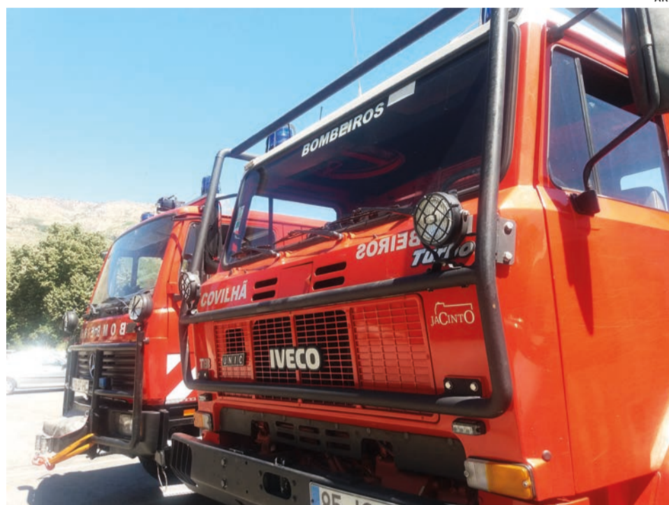
Diâmetro das condutas de abastecimento de água para o combate ao incêndio não tem a medida adequada por o Parque Industrial do Canhoso ser “de primeira geração”.