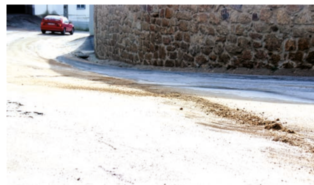
Buracos e mais buracos: é assim um dos principais acessos à vila

vias, quer na vila, quer no concelho, tem sido objecto de críticas por parte da oposição. Na semana passada, por exemplo, num bairro habitacional, o alcatrão abateu e abriu uma autêntica cratera em frente a um