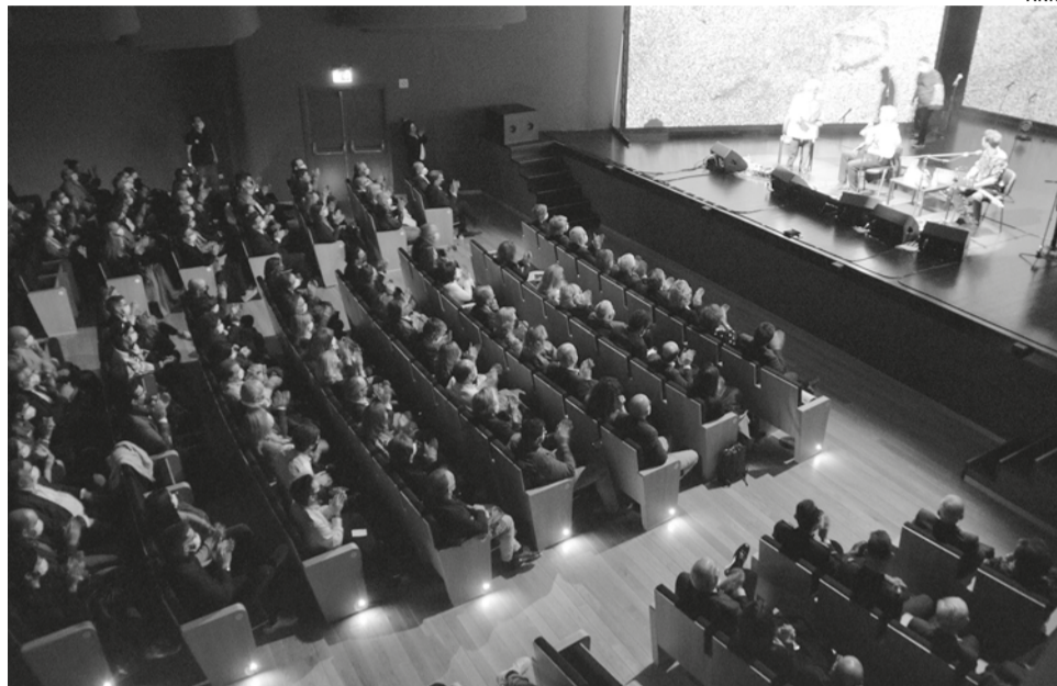
Presidente não descarta rever o documento “depois de um período de vigência razoável do regulamento”.

Questionado sobre as críticas feitas por associações da Covilhã, que só podem utilizar o espaço uma vez por ano, e com o apelo da oposição para que ajuste o regulamento “às necessidades locais”, o edil não descarta no futuro fazer essa revisão, mas não para já e sali-