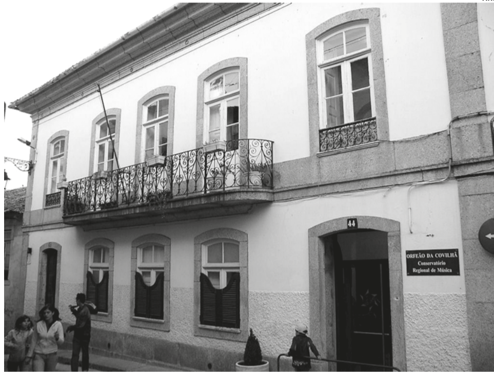
Vereadora da oposição propôs que edifício também passe a acolher, no piso inferior, o Agrupamento 20 dos escuteiros

Segundo o edil, além do antigo Orfeão, onde funcionava o Conservatório de Música da Covilhã, outros locais na cidade “estão a ser negociados, quer na premissa da aquisição, quer de arrendamento”, também com a finalidade de acolher instituições do concelho.