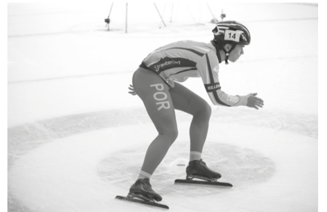
Foram 54 os patinadores que participaram na prova que se realizou na Serra da Estrela

A Federação de Desportos de Inverno de Portugal, com sede na Covilhã, realizou no final de 2021, na Holanda, um estágio internacional, bem como a Taça de Portugal de Patinagem de Velocidade no Gelo “Long Track”, tendo tido nos últimos meses vários atletas a participar em competições da Taça do Mundo, Campeonatos da Europa e Campeonatos do Mundo Júnior de Patinagem de Velocidade no Gelo.