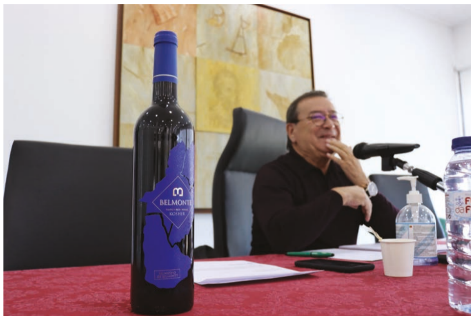
Autarquia acredita que adesão à associação pode ajudar a promover os vinhos locais