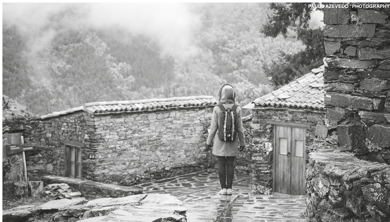
Reservas para uns dias nas Aldeias do Xisto têm que ser feitas até domingo para usufruir de desconto de 30 por cento, até final do ano

"São muitas as opções e programas únicos que temos à sua espera, que o convidam a imergir no nosso território e partir à descoberta das comunidades, da natureza e da cultura das Aldeias do Xisto", é referido na apresentação da campanha.