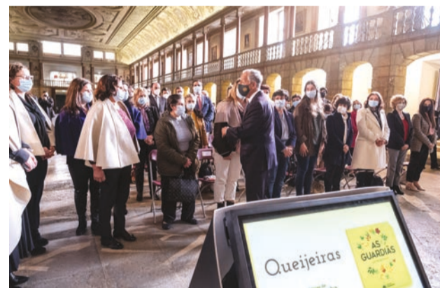
Marcelo homenageou mulheres, conheceu o projecto “Queijeiras” e lembrou a sua mãe, natural da Covilhã

O Presidente da República elogiou no passado dia 8 as mulheres trabalhadoras do Interior de Portugal, num encontro com produtoras de queijo, para assinalar o Dia Internacional da Mulher, em que homenageou também a sua mãe.