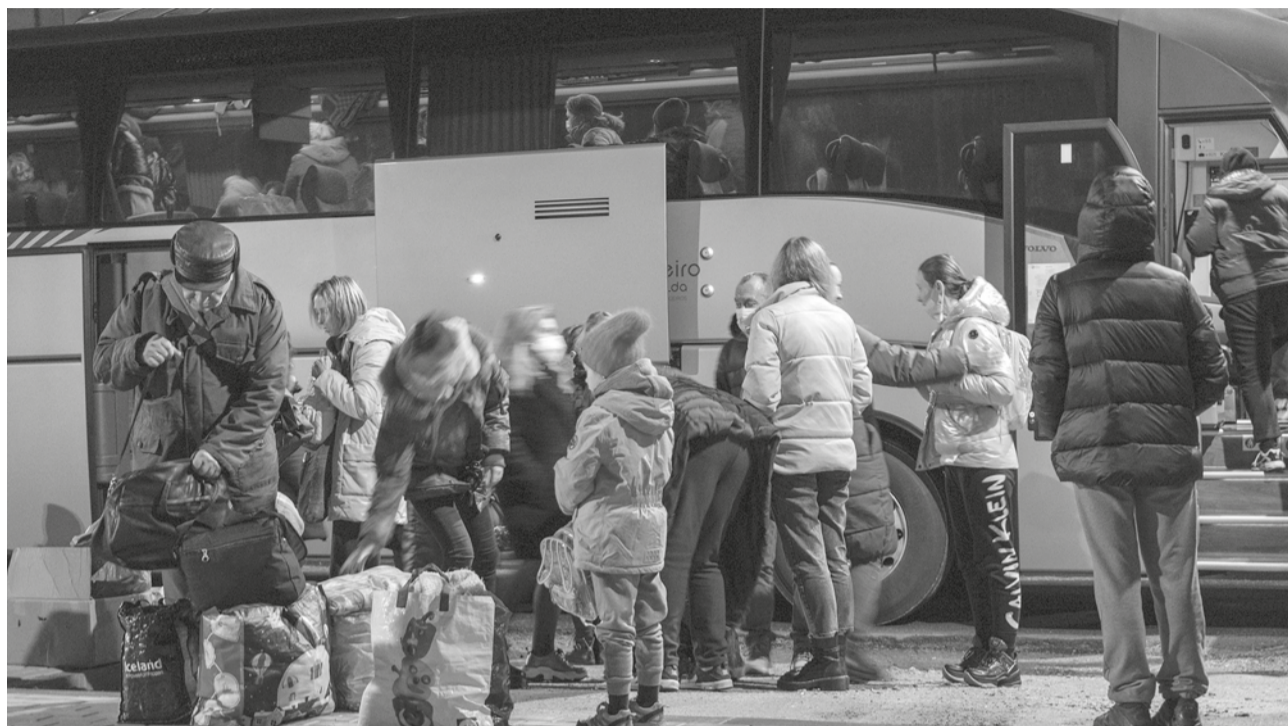
Refugiados ucranianos ficaram alojados na Pousada da Juventude. Uns, já seguiram para outros pontos do País, para junto de familiares, mas alguns ficaram

de mais alta por volta das 02:30 da madrugada e [os refugiados] ficaram alojados na Pousada da Juventude, onde os esperava uma refeição quente. Entretanto, durante o dia, já foram encami-