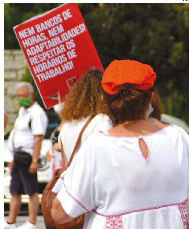
Intersindical salienta que as mulheres em Portugal recebem, em média, menos 14% do que os homens e apela para que os direitos dos trabalhadores sejam respeitados

A CGTP, citando novamente dados do INE de 2020, frisa que as mulheres representam cerca de metade da população activa e do emprego total e mais de metade do emprego assalariado, mas