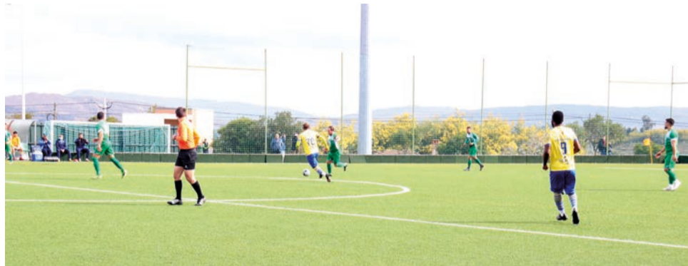
Num grande jogo de futebol, Amessan (número 9) fez a diferença para o Alcains, ao apontar três golos