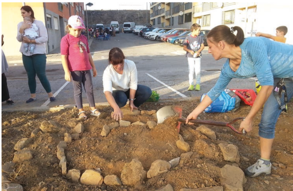
Projecto visa reabilitação do espaço exterior do Bairro Social do Cabeço

A Coolabora apresenta amanhã, sexta-feira, 8, na loja social do Bairro do Cabeço, entre as 11:30h e as 12 horas, o projecto de arquitectura “concebido de forma participativa” para o espaço exterior do Bairro Social do Cabeço, no Tortosendo e que surgiu do Projecto Saudinha financiado pelo Programa Bairros Saudáveis.