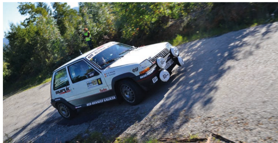
Dupla espanhola, em Renault 5 GT Turbo, foi a mais rápida na Sertã