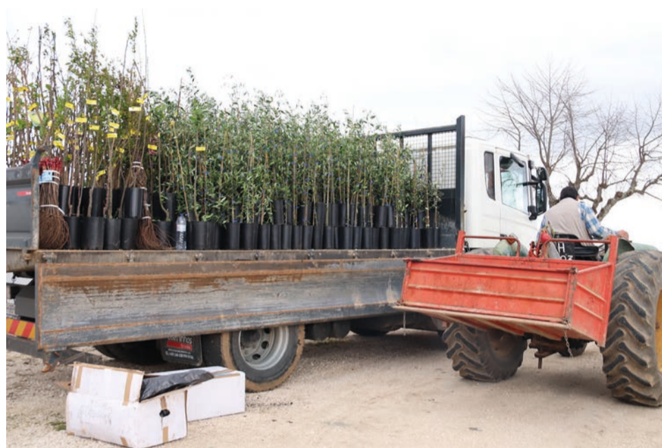
A entrega de árvores em Vale de Água

No âmbito do projecto 'Condomínio da Aldeia - Programa de apoio às aldeias localizadas em territórios de floresta', uma iniciativa da Direcção-Geral do Território, apoiada pelo Fundo Ambiental, com a intenção de reconverter áreas florestais em áreas agrícolas, localizadas na faixa dos cem metros de protecção em redor do aglomerado populacional, serão no total distribuídas pelos habitantes destas terras cerca de 19 mil árvores, num investimento a rondar os 31 mil euros.