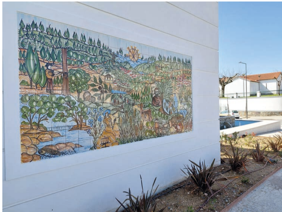
Este é um dos dois novos painéis que pode ver em Oleiros

O município, em comunicado, diz que encara a arte urbana como um “valor cultural, acessível a todos, que dá cor ao edificado e que permite aos artistas mostrarem a sua arte. Em Oleiros esta expressão artística na