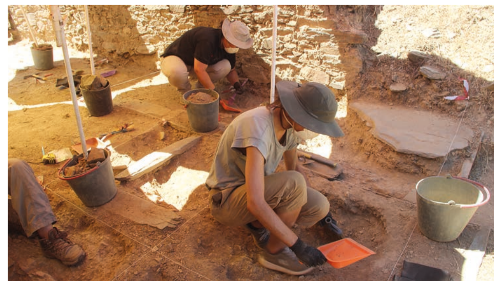
Campo arqueológico decorre entre 4 e 30 de Julho

O primeiro campo será no espaço da Bateria das Baterias - séculos XVIII e XIX -, a decorrer de 4 a