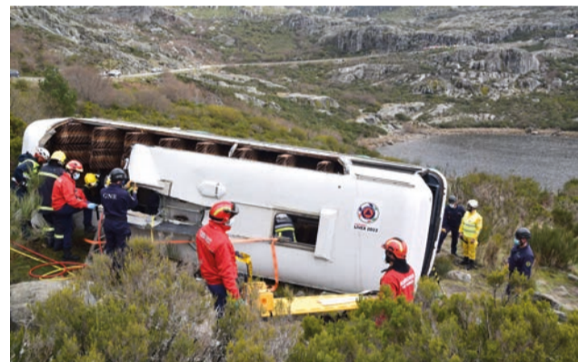
Simulacro consistiu no acidente de um autocarro na Serra e no resgate das vítimas

ção de desaparecimento, de um marroquino de ascendência portuguesa. A vítima foi encontrada apenas com ferimentos ligeiros, dispensando