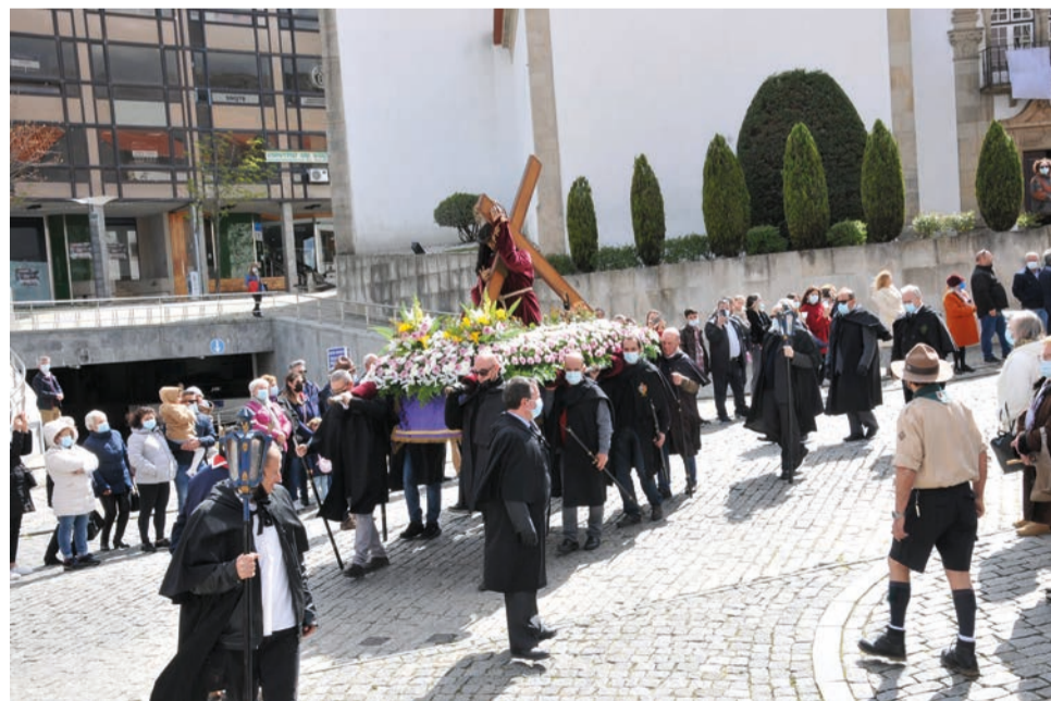
Procissão dos Passos decorreu no domingo na Covilhã

Ainda no dia 15, pelas 11 horas, na Igreja da Misericórdia, decorre a celebração “As Sete Palavras de Jesus na Cruz”.