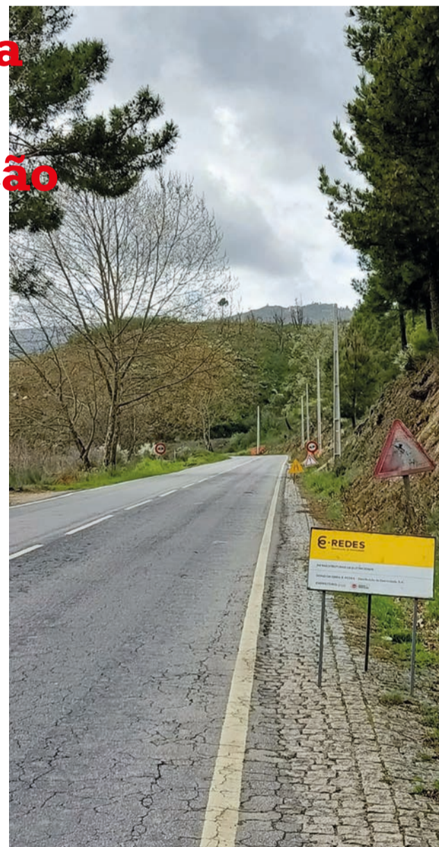
Autarquia diz que quer dar mais segurança à entrada norte da cidade

Trata-se de uma obra, cujo investimento é suportado pelo município e pela distribuidora E-Redes, que visa dotar este troço da via com uma rede de iluminação com “caraterísticas urbanas”. A Câmara Municipal sustenta que desta forma pretende dar mais segurança “à entrada norte da cidade da Covilhã”.