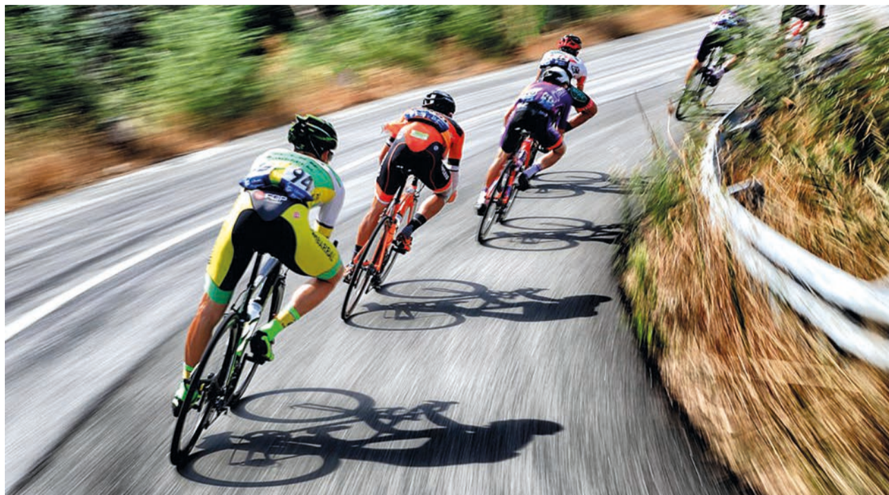
Pelotão conta com 110 jovens ciclistas de 19 equipas, cinco delas estrangeiras

Hoje, a primeira etapa liga as Caldas da Rainha a Abrantes, num total de 136 quilómetros. Na sexta-feira, a segunda etapa é entre a Lousã e Águeda, e no sábado, a terceira, entre Ovar e São Pedro do Sul.