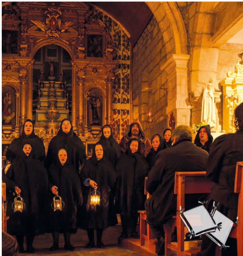
Idanha-a-Nova preserva muitas das tradições pascais e quaresmais, como os cânticos alusivos a esta época do ano

A sessão de abertura é no dia 8, pelas 16 horas, no Fórum Cultural. Dá início a uma iniciativa ímpar na agenda dos Mistérios da Páscoa em Idanha, um território que mantém um ciclo de cerca de 300 tradições quaresmais e pascais ao longo de 90 dias, desde a Quarta-Feira de Cinzas