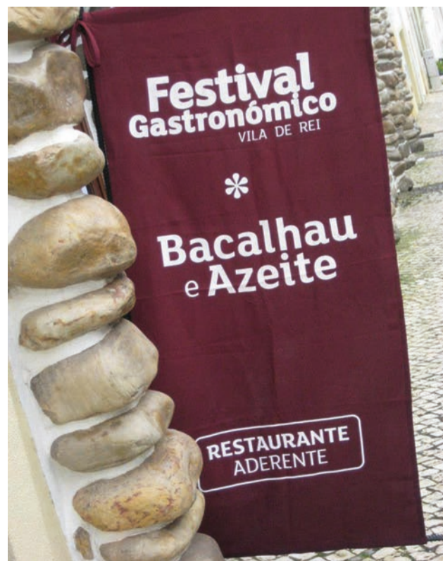
Todos os restaurantes do concelho aderem à iniciativa

Organizado pela Câmara de Vila de Rei, o evento vai contar com um passatempo, através do qual os restaurantes aderentes vão oferecer uma refeição para duas pessoas, a um dos clientes que adquira um prato de bacalhau durante os dias do festival.