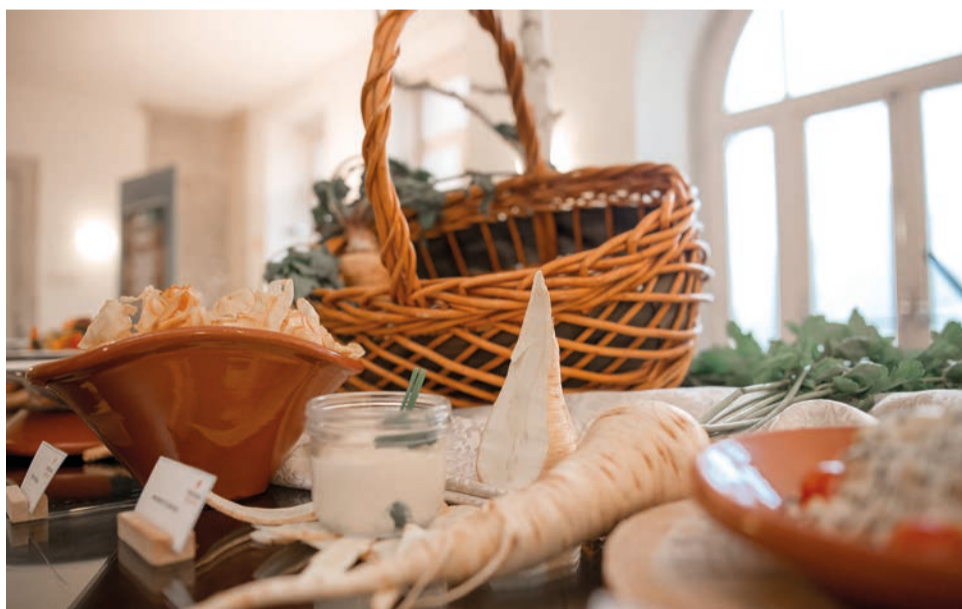
Confraria da Cherovia e Panela do Forno entroniza no sábado novos confrades

A Confraria Gastronómica da Cherovia e Panela no Forno da Covilhã realiza no próximo sábado, 9, mais um capítulo.