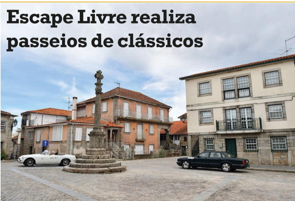
Automóveis clássicos, em Junho, na região

Já na vertente turística a novidade é que a partir deste ano o Escape Livre vai trazer ao Classic