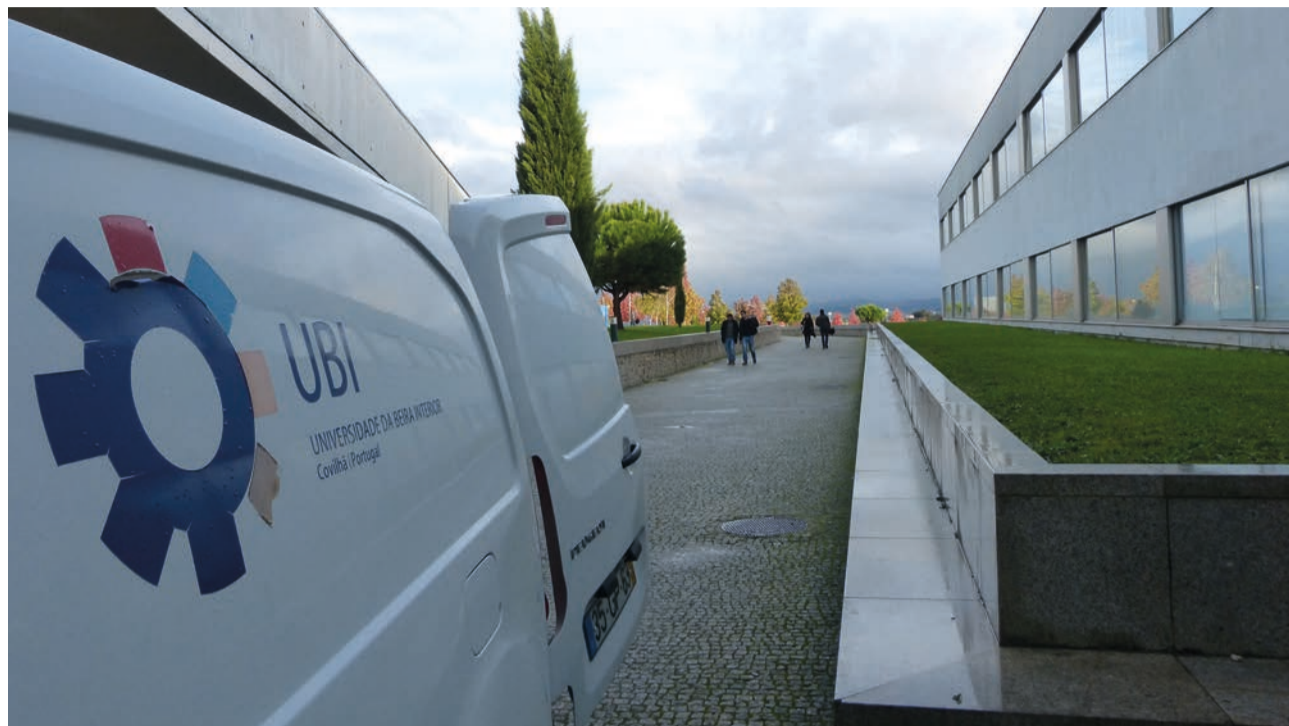
Grande auditório da Faculdade de Ciências da Saúde acolhe evento

O evento decorre no grande auditório da Faculdade de Ciência da Saúde da UBI, com a organização a prometer “um grande evento para