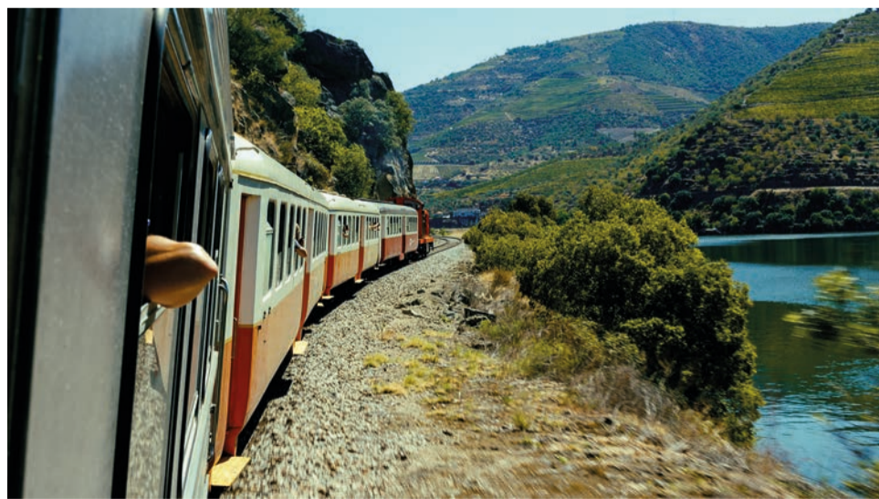
CP promove no domingo uma viagem cultural pela Linha da Beira Baixa

A composição de locomotiva e carruagens, com três das carruagens Schindler que circulam nos comboios da Linha do Douro, dispõe de uma oferta de 216 lugares e vai percorrer a lezíria ribatejana, através das margens do rio Tejo, na Linha da Beira Baixa, “permitindo admirar as paisagens únicas do Castelo de Almourol, Castelo de Belver e Monumento Natural Portas de Ródão” diz a empresa em comunicado.