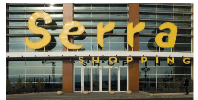
Exposição está patente no Serra Shopping até sexta-feira

“Depois de termos recebido esta acção em 2017,