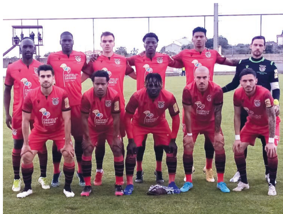
Benfica e Castelo Branco bateu o Condeixa por 4-1