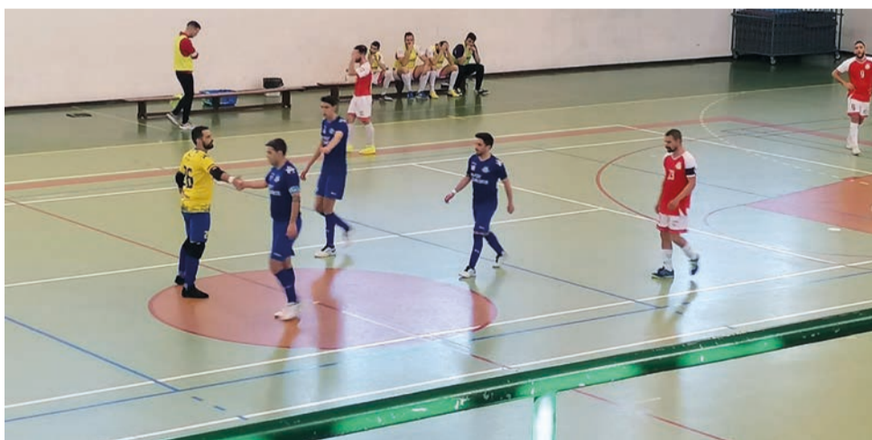
Cariense entrou forte no jogo e aos 8 minutos já vencia por quatro golos de diferença

A União Desportiva Cariense é a primeira equipa apurada para a final do play-off do Campeonato Distrital de Seniores Masculinos de Castelo Branco, depois de, no passado sábado, em Belmonte, ter batido o vizinho Ceurde-Carvalho Formoso por 6-2, no segundo jogo das meias-finais. No primeiro já tinha vencido em casa.