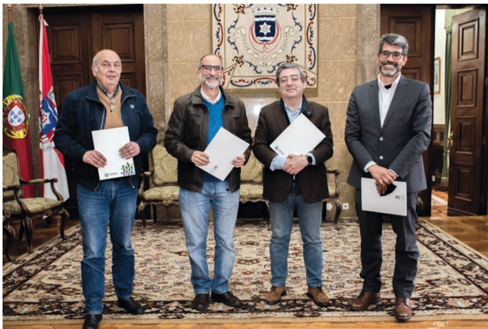
Responsáveis do Centro de Estudos reuniram na Covilhã esta semana