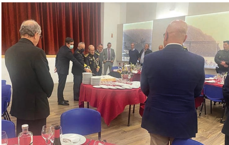
Dia da Unidade e 13º Aniversário do Comando da GNR de Castelo Branco foi assinalado em Vila Velha de Ródão