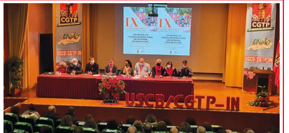
Nova direcção resulta do Congresso realizado há cerca de duas semanas, em Castelo Branco