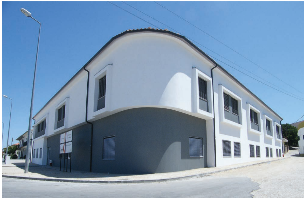
Em 2021, o passivo foi de 144 mil euros e, no total, o passivo da instituição é superior a 252 mil euros

“Sob os princípios de transparência e de abertura à comunidade”, a actual direcção da instituição comunicou que recebeu no dia 25 de Março, dos serviços externos de