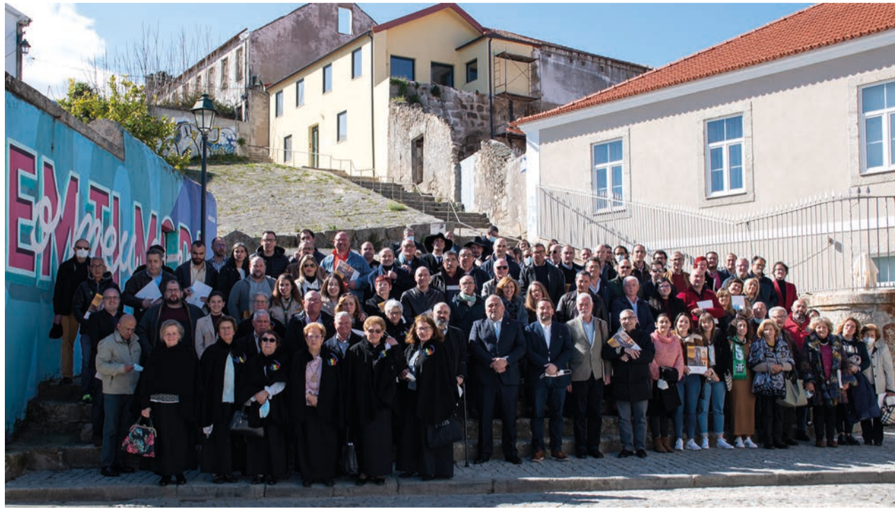
Foram mais de 60 as associações que receberam da autarquia contratos-programa para desenvolvimento das suas actividades

O autarca destacou a forte adesão do movimento associativo a este programa e diz que, quando há quase quatro anos se iniciou a elaboração do documento, “não pensá-