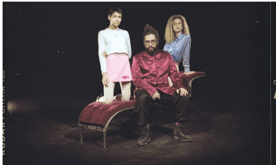
“The Ever Coming – Cosmophonía” de Dada Garbeck, é o primeiro espectáculo, dia 13, às 21h30, no Teatro Municipal da Covilhã