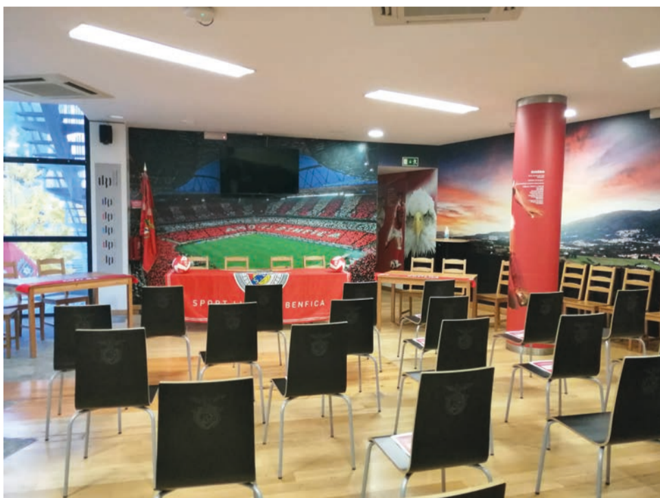
Casa do Benfica vai a votos no dia 7 de Maio

Ficou ainda agendado para dia 7 de Maio a eleição dos novos órgãos sociais para o próximo triénio.