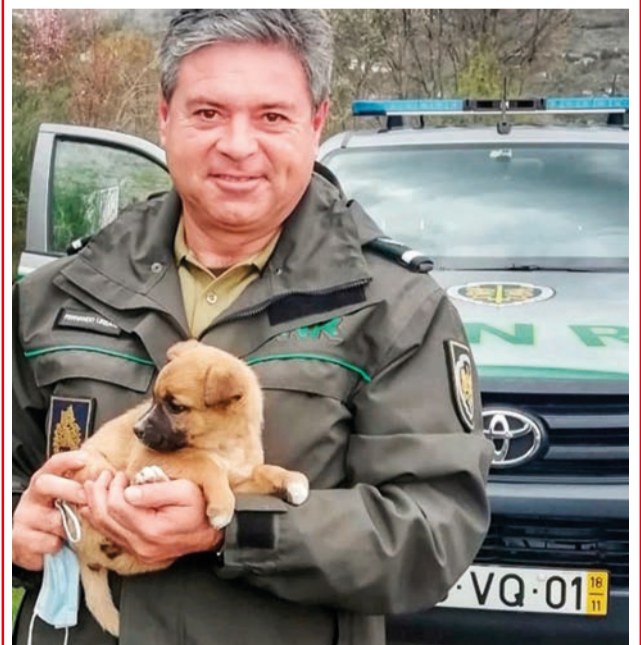
Os três cachorros foram encontrados sem ferimentos

A GNR recorda, em comunicado, que o abandono de animais de companhia é um crime punível com pena de prisão até seis meses ou com pena de multa até 60 dias.