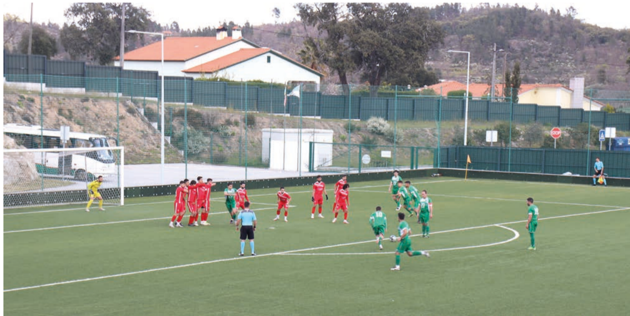
Em Pedrógão, equipa da casa bateu o Moradal por 3-1 e “deu” liderança isolada ao Alcains; em Belmonte, Proença ganhou e reacendeu luta pelo quinto lugar

autogolo de Djaló, aos 52 minutos, deixou o Pedrógão na frente, que confirmaria os três pontos ao minuto 84, com um golo de Tomás Sousa.