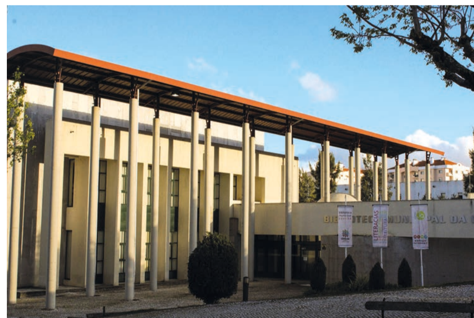
Biblioteca promove actividades para a Páscoa

A Biblioteca Municipal da Covilhã promove na próxima semana diversas actividades de ocupação de tempos livres