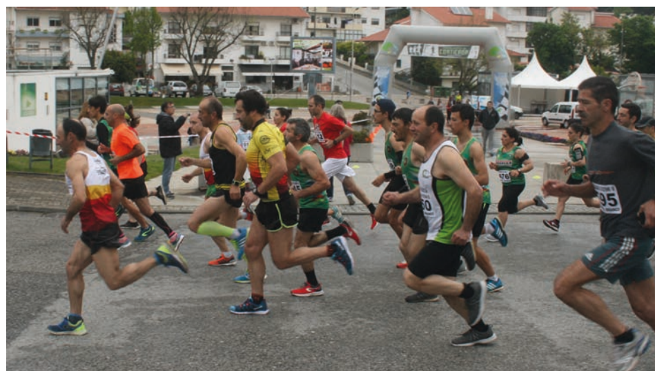
Prova disputa-se no próximo domingo

Para esta corrida existem 11 escalões diferentes, com diferentes distâncias a serem percorridas por cada um deles, adaptando as dificuldades às idades. A prova rainha, dedicada a Juniores, Seniores e Veteranos tem uma distância de 10 quilómetros.