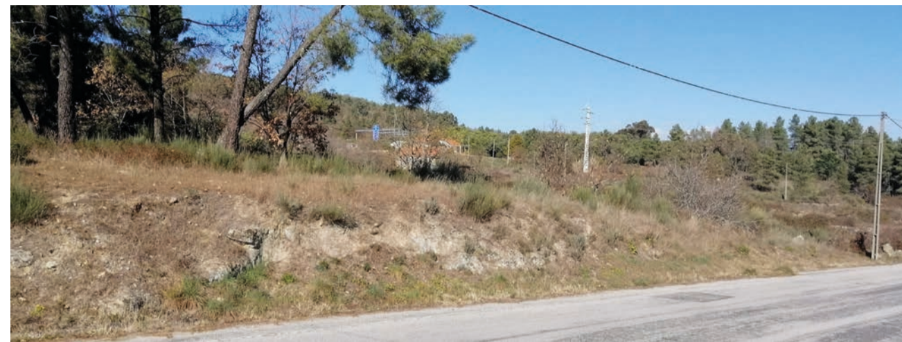
Nova área empresarial vai nascer em Maçainhas, bem perto do nó da A23

O projecto prevê a criação de 20 novos lotes