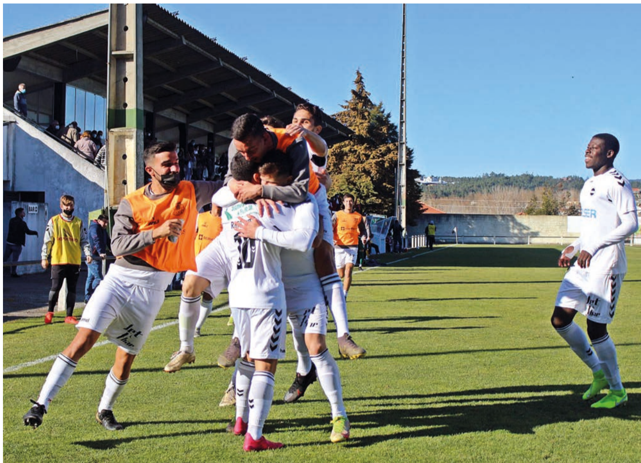
Foi em cima do minuto 90 que o Sertanense conseguiu marcar, no terreno do Moncarapachense