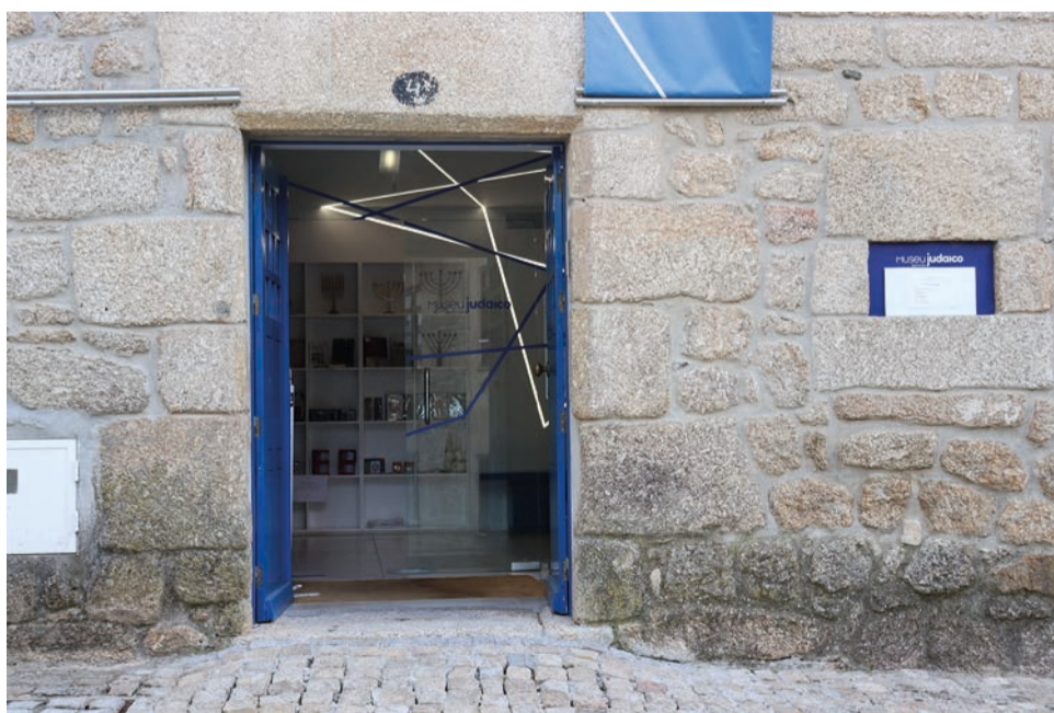
Lusofonia volta a ser debatida em Belmonte, com o Museu Judaico a ser palco principal

Belmonte é palco, pela quinta vez, dos Colóquios da Lusofonia, que este ano celebram 20 anos de existência.