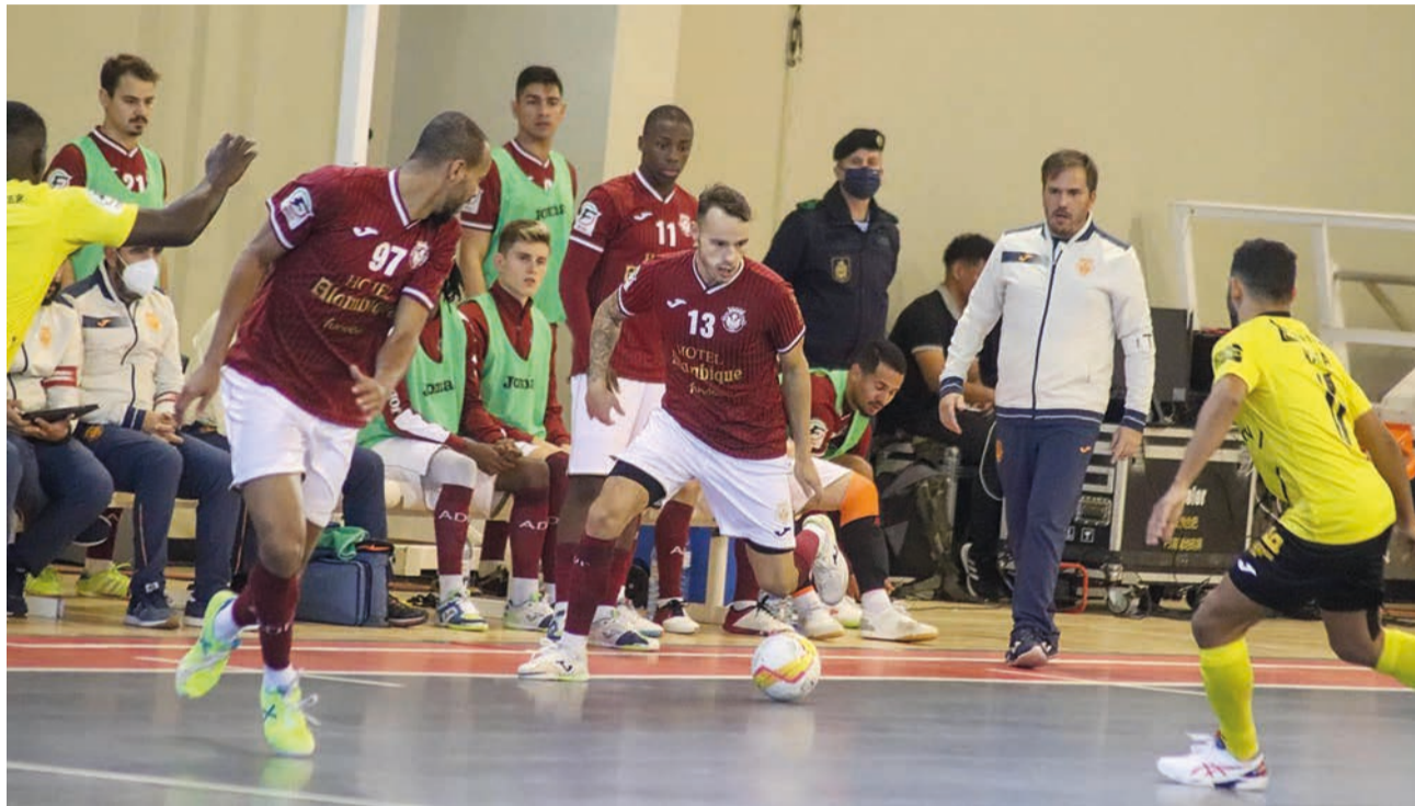
À terceira, foi de vez: Desportiva bateu Quinta dos Lombos

Jogo bom, intenso, com grandes golos e incerteza no marcador. Tal como já tinha sucedido na primeira volta do campeonato, e também na Taça de Portugal (eliminatória foi decidida nas grandes penalidades), Quintas dos Lombos e Desportiva do Fundão protagonizaram no passado sábado uma grande partida de futsal, na 21ª jornada da Liga Placard (nacional da primeira divisão). Mas desta vez, a vitória sorriu à equipa