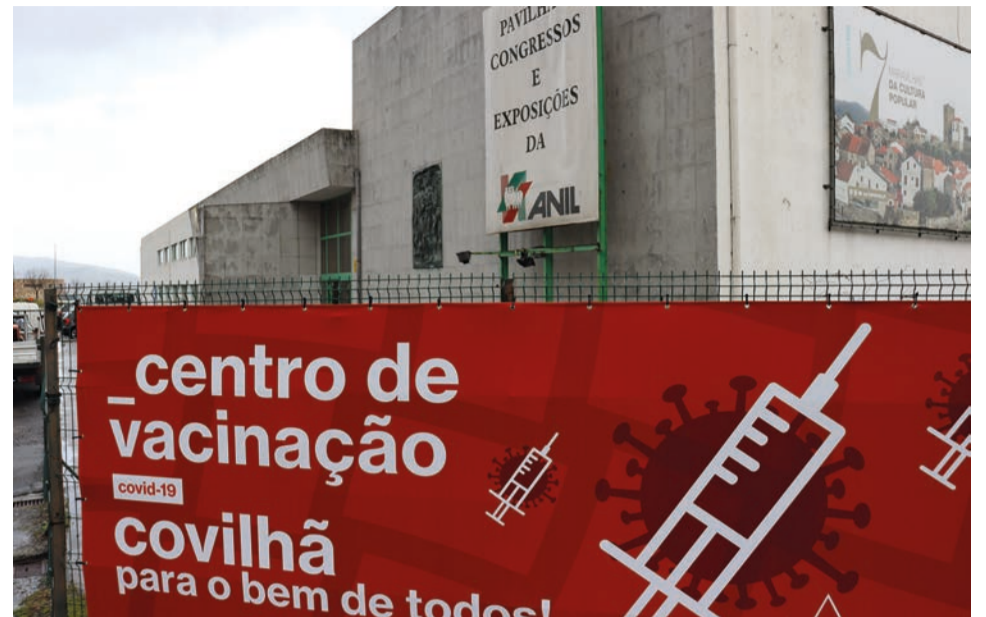
Centro de vacinação da Anil já foi desactivado

O Agrupamento de Centros de Saúde (ACES) da Cova da Beira reajustou os horários e locais de funcionamento da vacinação contra a covid-19, que desde esta semana voltou a fazer-se nos centros de saúde locais.