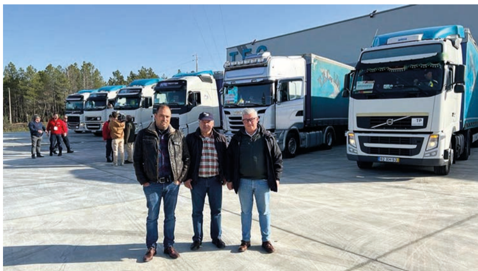
Nova missão, com seis camiões, saiu na passada semana em direcção à Ucrânia

A deliberação aconteceu em reunião de Câmara, no dia 29 de Março, véspera da partida de seis camiões em direcção à Ucrânia para uma nova operação de ajuda humanitária, conduzida pela Federação dos Bombeiros