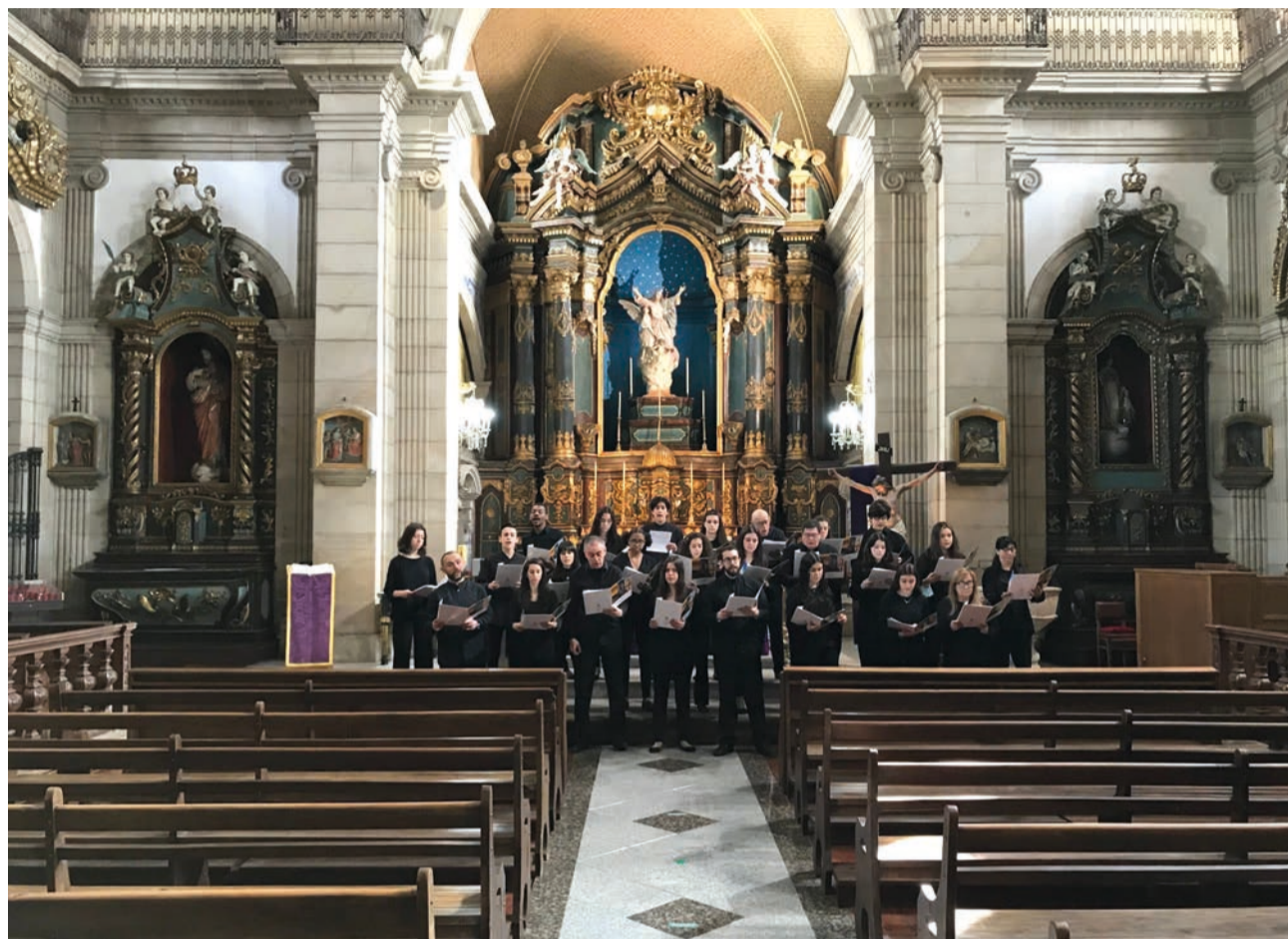
Coro Misto gravou na passada semana vídeos de divulgação do património religioso da cidade

A obra tem onze andamentos, toda escrita em latim, e será interpretada