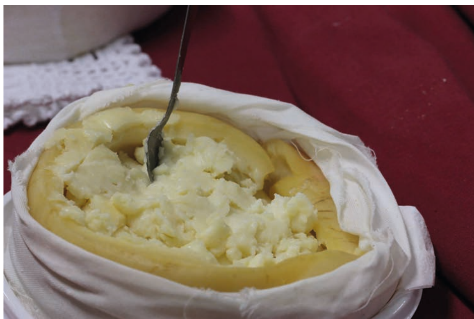
Feira do Queijo de Seia decorre entre sábado e segunda-feira

Dedicado ao afamado queijo de ovelha, o Queijo Serra da Estrela DOP, a que se acoplam outros produtos endógenos (enchidos serranos, pão, mel, vinho...), a feira conta com uma centena de expositores, distribuídos pelo Mercado Municipal e zona circundante.