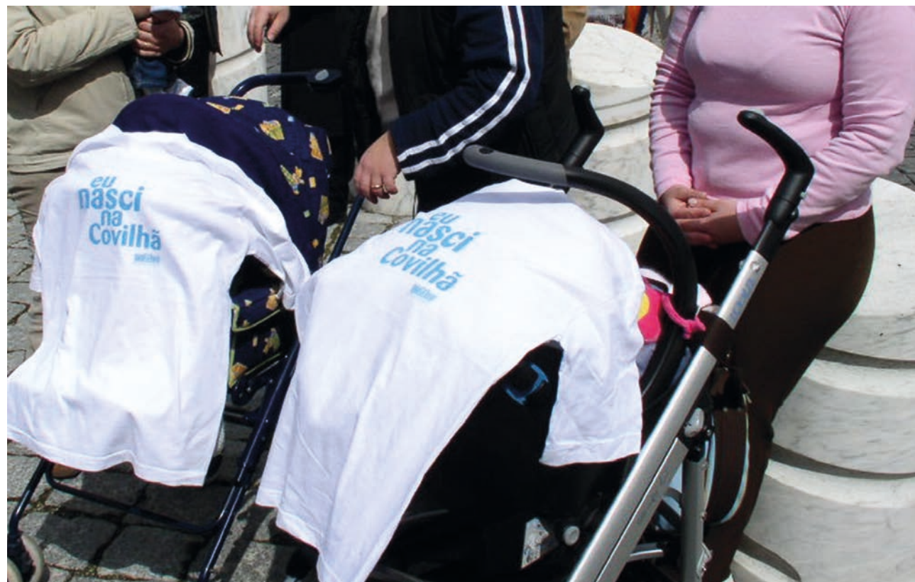
No primeiro trimestre deste ano nasceram na Guarda 135 bebés, em Castelo Branco, 231

Apesar da recuperação, este é o segundo primeiro trimestre do ano com um