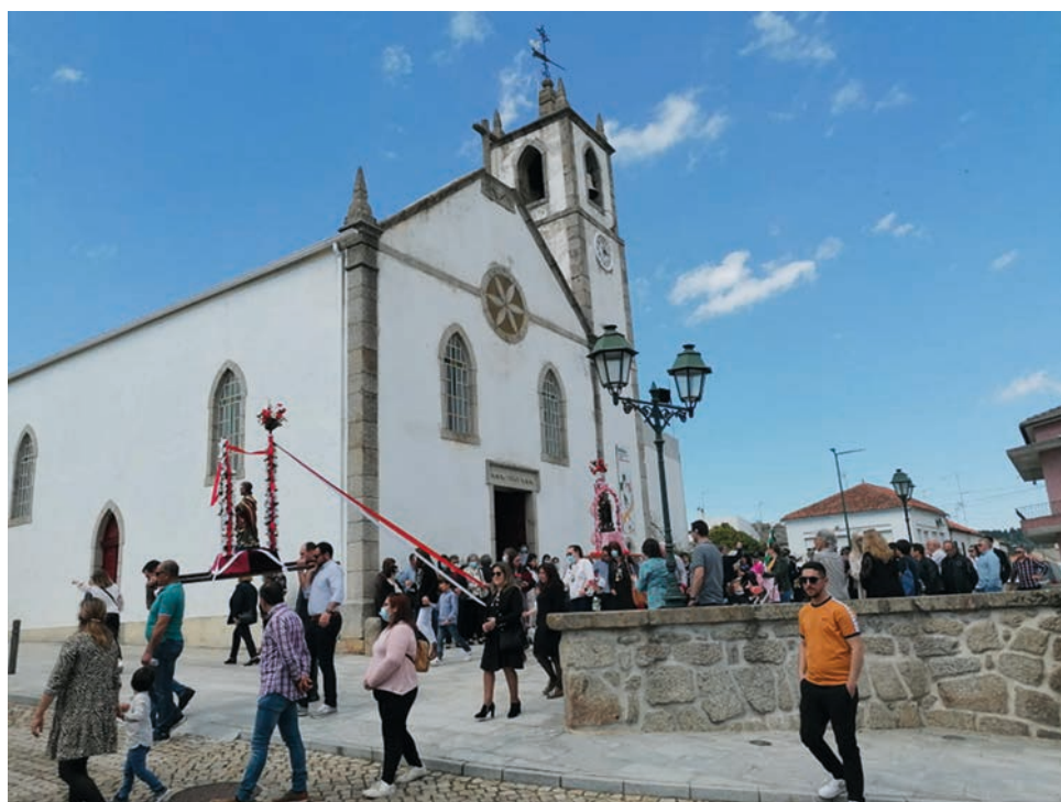
A procissão da noite, ao domingo, e a recepção à banda filarmónica, sempre “regada” com vinho caseiro e com iguarias locais, são dois dos momentos altos da festa

forma mais participativa do povo, os dias vividos. A covid-19 travou a tradi-