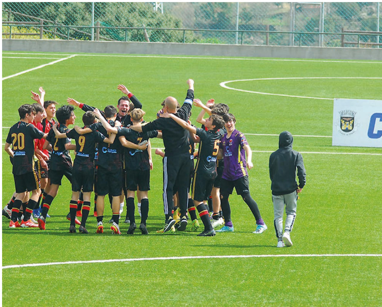
Guarda Unida homenageia com torneio a sua equipa de juvenis, campeã distrital

Os jogos disputar-se-ão, em duas partes de 25