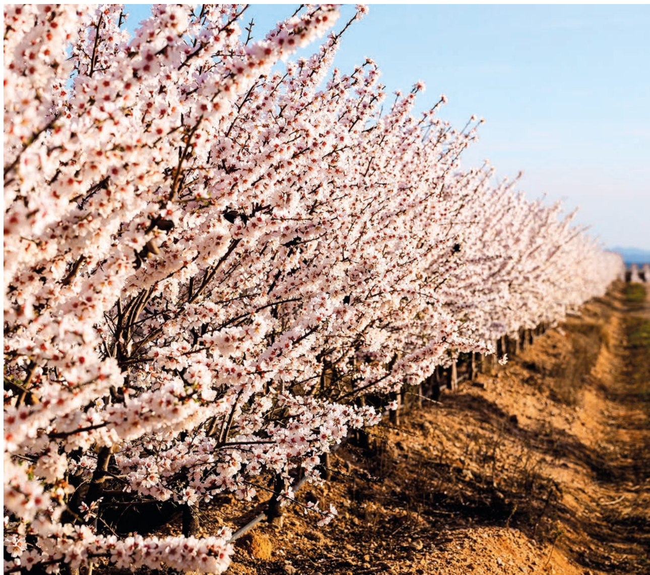
Empresa gere uma área de 1300 hectares de amendoal nos concelhos de Idanha-a-Nova e Fundão

A Veracruz está sediada em Idanha e lidera um projecto agrícola com um investimento de cerca de 40 milhões de euros