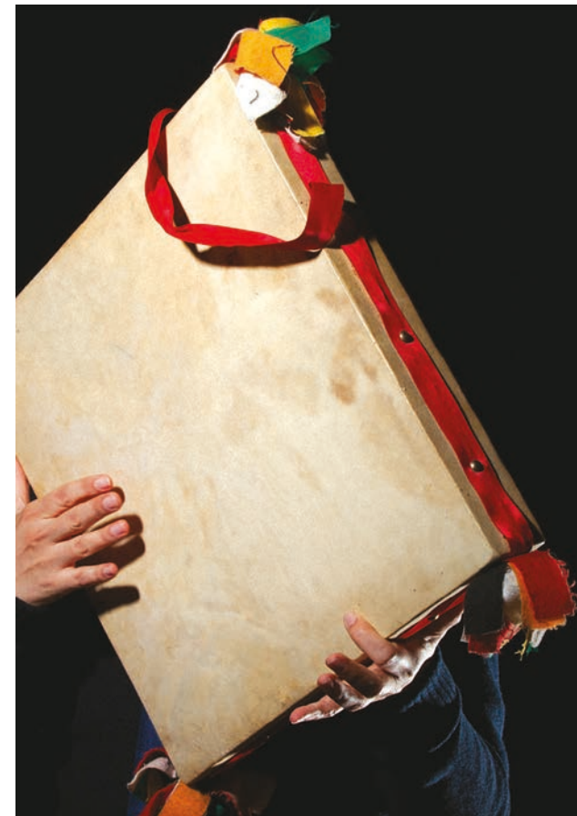
Pela primeira vez, o Adufe recebeu o prémio, na categoria “Artesanato”

Monsanto e o Adufe, duas referências do concelho de Idanha-a-Nova, estão entre os vencedores do Prémio Cinco Estrelas Regiões 2022, assim como o Clube de Tiro de Monfortinho.