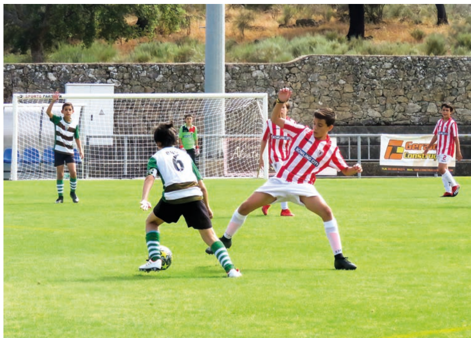
Torneio jovem é destinado aos escalões de benjamins, infantis e iniciados

“O Idanha Cup é hoje uma referência no País, pela qualidade da organização e os mais de mil