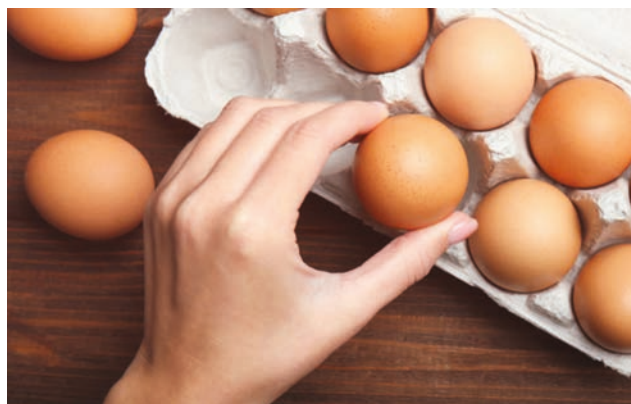
Falta de informação obrigatória levou ASAE a apreender 1.338.120 ovos em Castelo Branco

As apreensões, de um total de 1.354.920 ovos, foram levadas a cabo por brigadas especializadas das indústrias das unidades regionais do centro e do norte da Autoridade de Segurança Alimentar e Económica (ASAE), segundo anunciou em co-