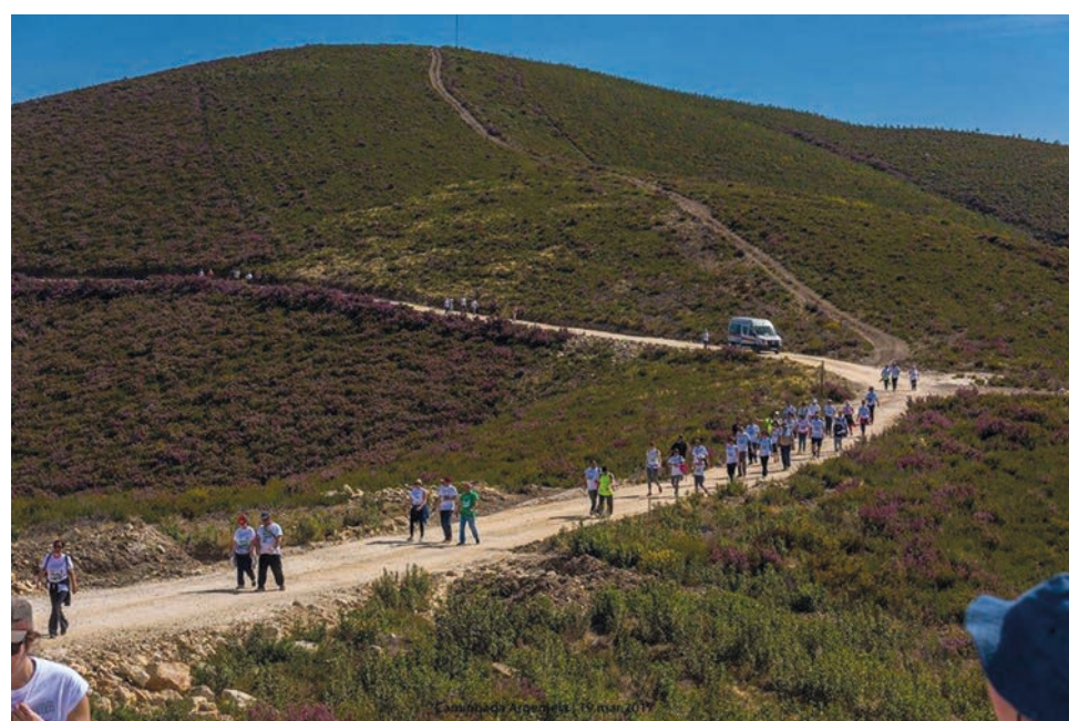
Um dos objectivos da iniciativa é debater as questões relacionadas com a exploração mineira na Argemela

A II Rota dos Castros conta com a parceria dos municípios do Fundão e da Covilhã, da Freguesia de Lavacolhos e da União de Freguesias do Barco e Coutada.