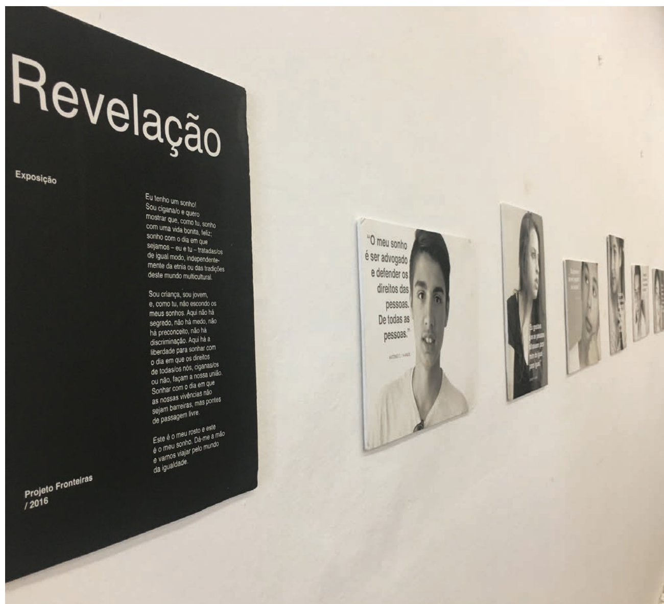
Mostra é composta por rostos de 15 crianças ciganas que revelam os seus sonhos

“Revelação” está patente na sala de eventos da Coolabora até ao próximo dia 29, podendo ser visitada de segunda a sexta-feira, entre as 9 e as 18 horas.