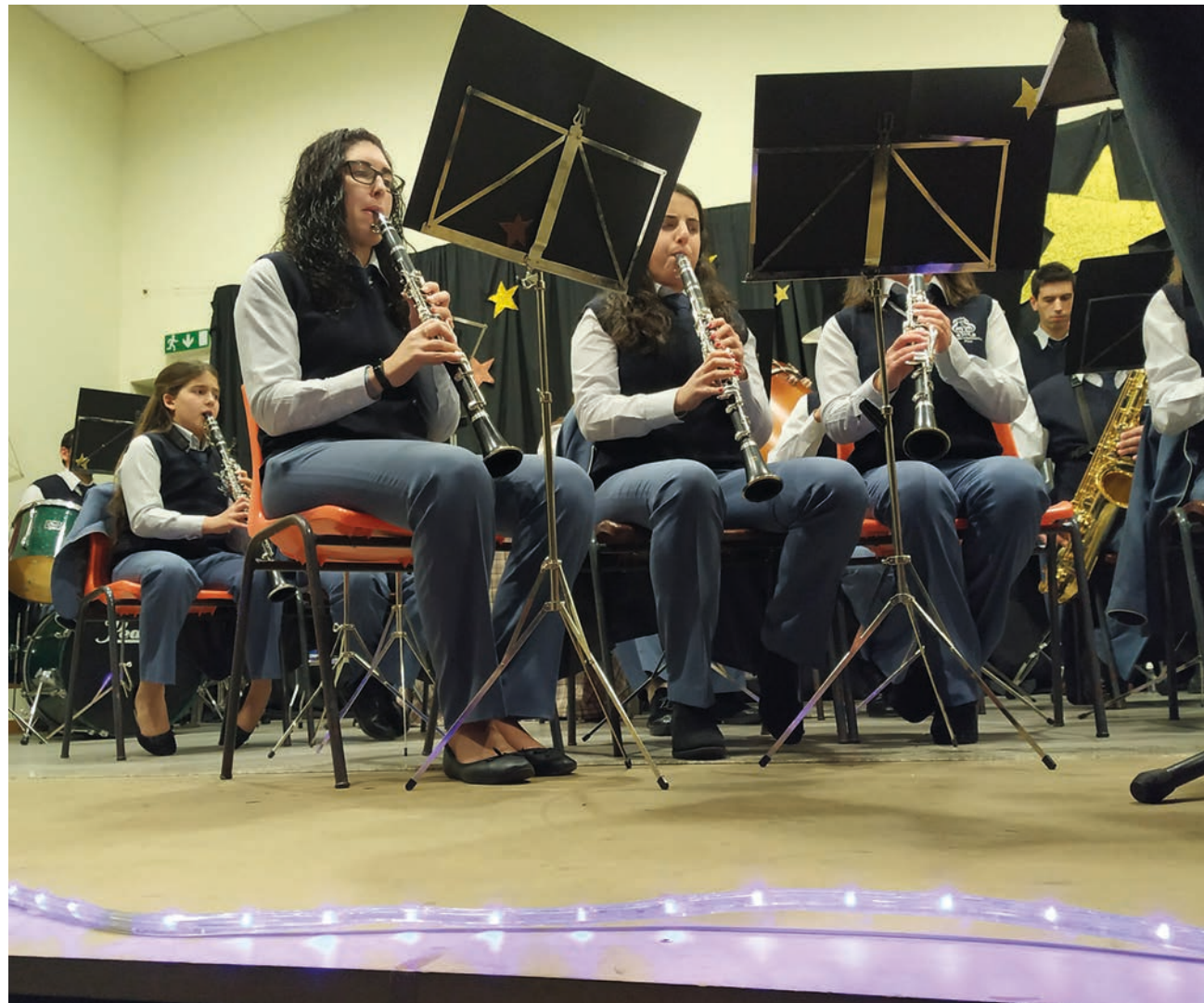
Banda do Paul realiza concerto comemorativo no auditório da vila, no domingo, 24, às 21 horas e 30

Não estando directamente ligada às comemorações da efeméride, refira-se que logo no sábado, 23 de Abril, a recente Associação Dona Beatriz vai inaugurar este espaço socioeducativo em Portugal. Refira-se a propósito que esta associação tem como objectivo desenvolver uma acção social de apoio a pessoas idosas e analfabetas que necessitam de ser acompanhadas no preenchimento de documentos administrativos, mas também a pessoas que pretendam adquirir as