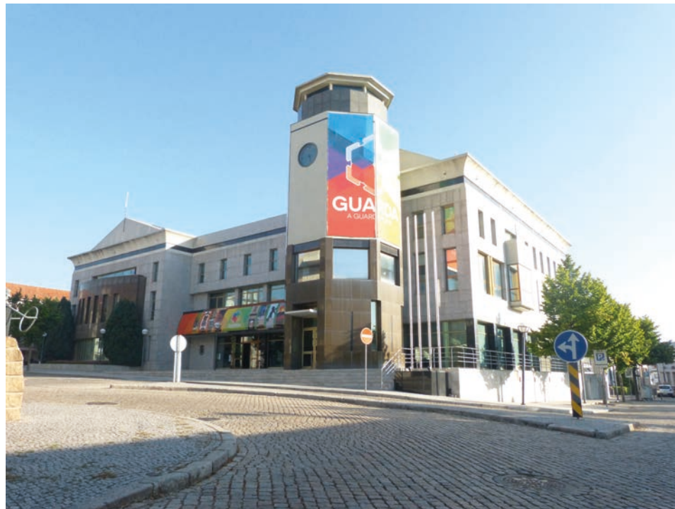
Câmara da Guarda vai passar a contar com dez divisões, sendo quatro delas novas

“[A nova estrutura orgânica] foi aprovada hoje por unanimidade na Câmara e esperamos que agora seja aprovada na Assembleia Municipal, também, para que possamos, dessa forma, trabalharmos melhor e irmos de encontro, às pretensões dos guardenses. E, desta forma, prestarmos um melhor serviço aos nossos cidadãos”, disse aos jornalistas o presi-