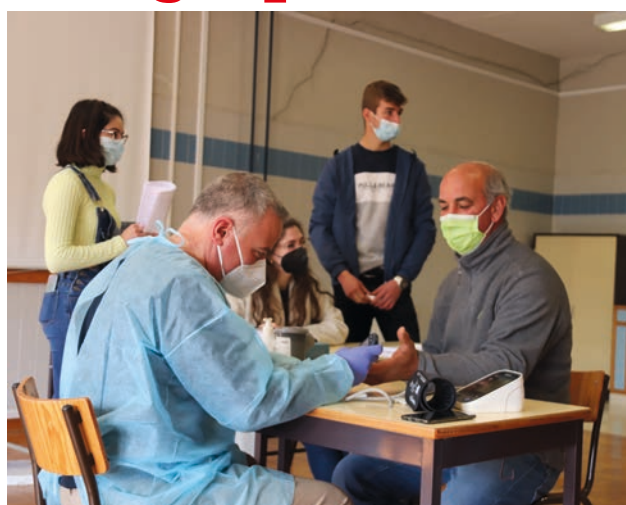
Além dos alunos, professores e funcionários também foram rastreados