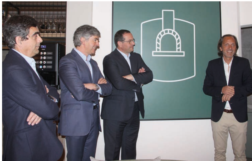
Alojamento local dispõe de seis apartamentos T3

O autarca recordou os dados estatísticos que demonstram um crescimento acentuado do turismo em toda a Zona Centro do País, quando comparado com outras regiões: “apesar de tudo aquilo que de mal trouxe a pandemia da covid-19, trouxe também a redescoberta destes territórios, relativamente a esta identidade, que mesmo sem grande intervenção humana, tem condições diferenciadas para atrair