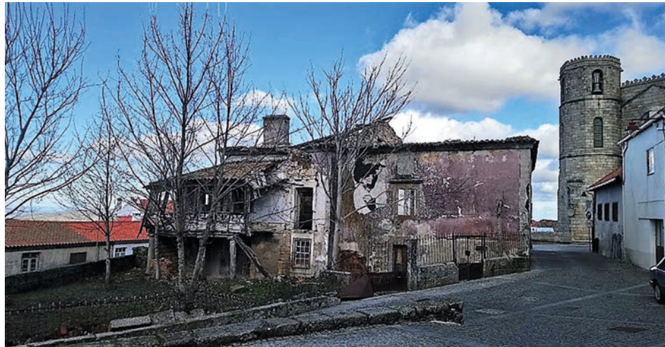
População vai ter uma palavra a dizer sobre o destino do edifício que fica localizado junto à Sé