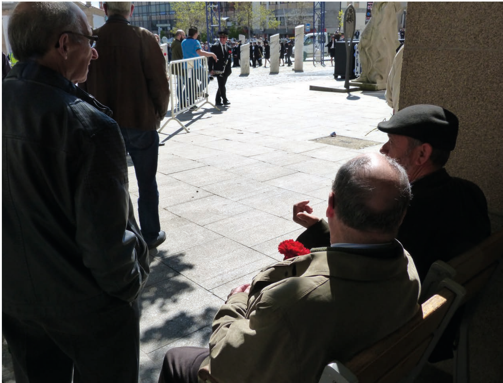
Comemorações de Abril regressam, após dois anos em que ficaram praticamente “confinadas”

Já o 1º de Maio, tem mais iniciativas, em diversos locais, e também andarà na rua. Na Covilhã, pelas 9 horas haverá a tradicional alvorada, com a Banda da Covilhã a levar música às ruas da cidade, bem como a visitar alguns lares de idosos. Depois, às 10