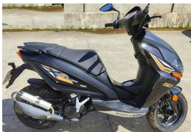
A moto que foi recuperada

Orlando da Mata integrou também o Governo de Angola, no cargo de Vice-ministro da Ciência e Tecnologia, e foi o representante daquele país no Comité Consultivo Multidisciplinar de Ciência e Tecnologia da SADC da Convenção das Nações Unidas de Combate à Desertificação.