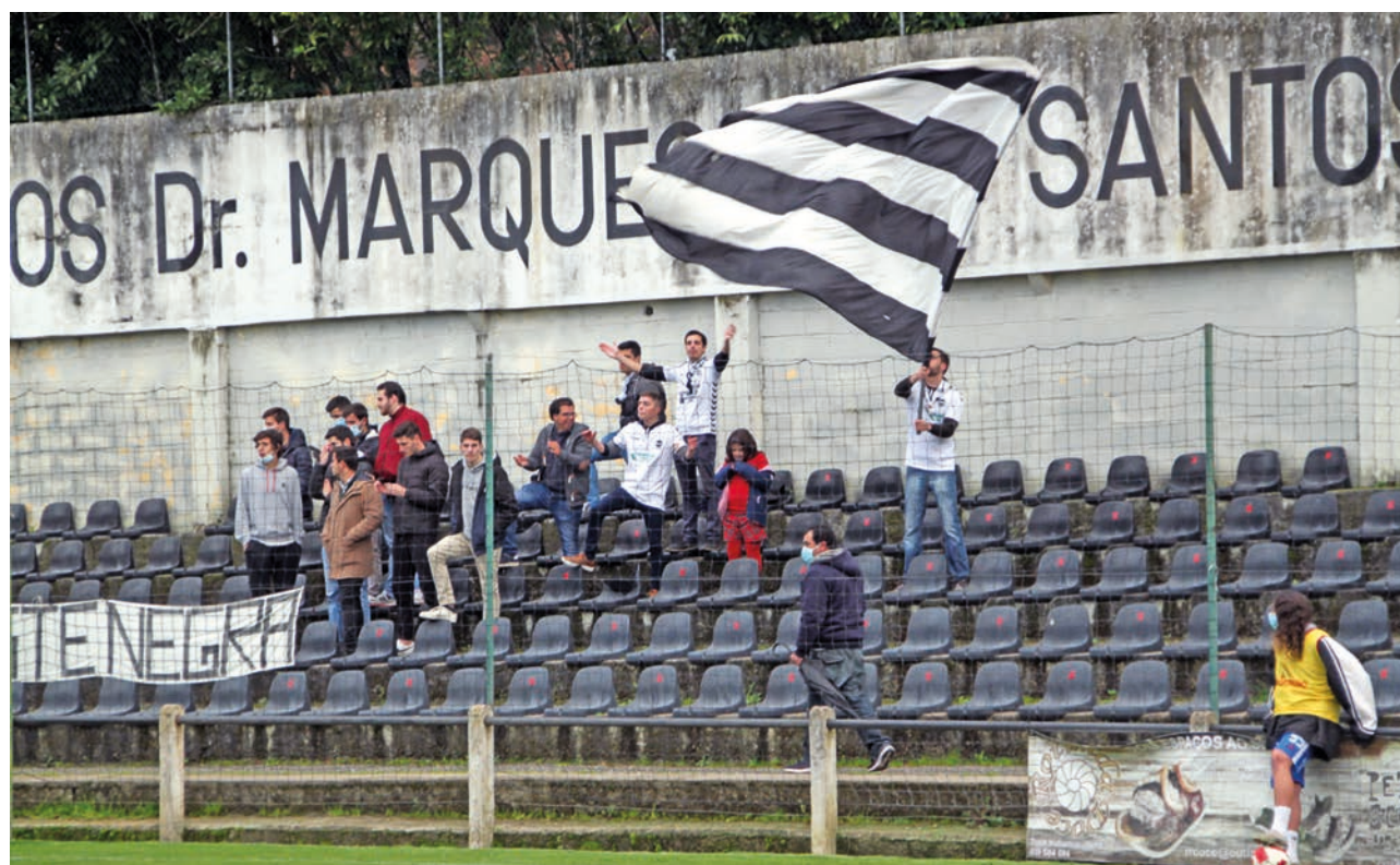
Sertanense joga domingo, em casa, frente ao Olhanense

No domingo, às 16 horas, o Sertanense recebe o último, Olhanense.