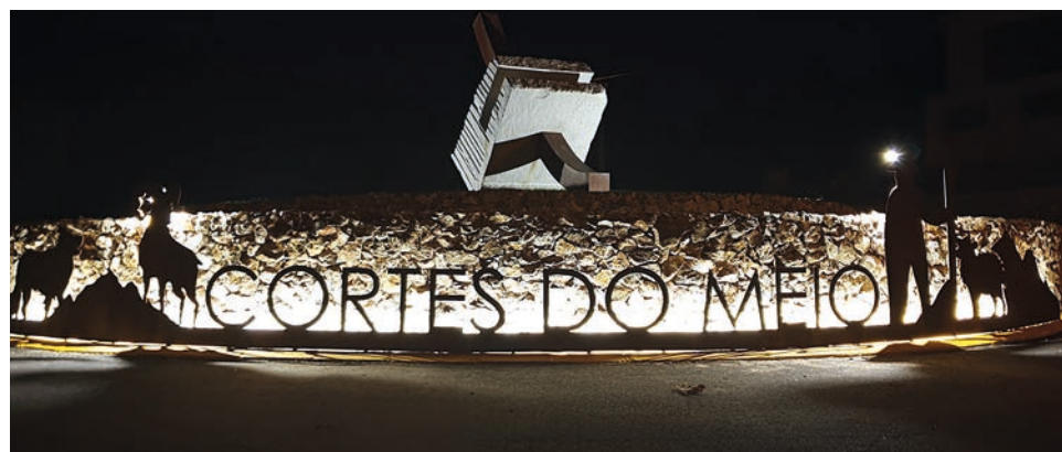
Objectivo é a dinamização das infra-estruturas existentes na freguesia

O mesmo prevê a dinamização cultural, recreativa, lúdica e desportiva das infra-estruturas da freguesia de Cortes do Meio, sendo que o UFCT compromete-se a colaborar/realizar, iniciativas, projetos e ações nomeadamente na vertente cultural, social, lúdica, recreativa e desportiva,