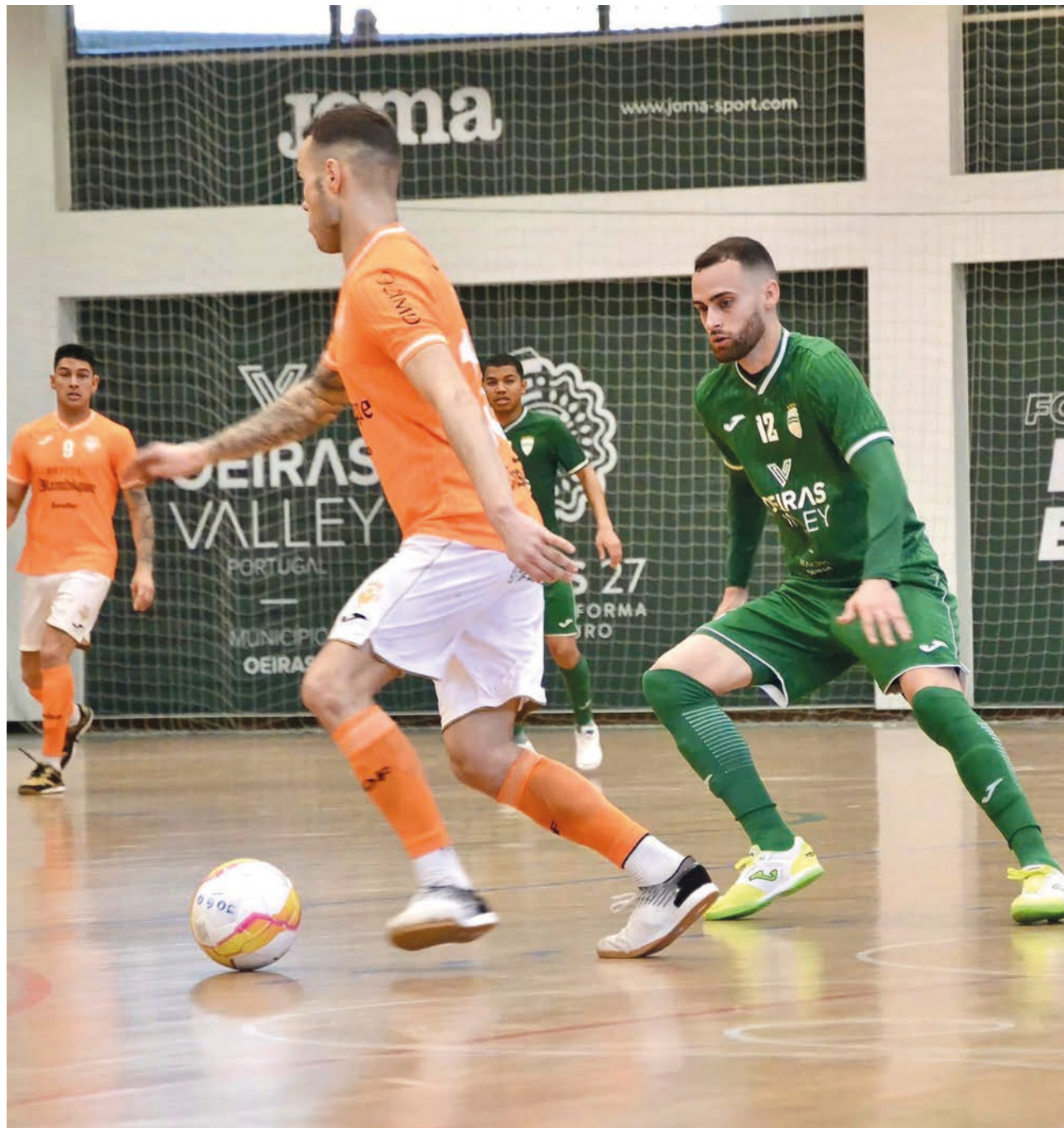
Num jogo bem disputado e emotivo, Desportiva do Fundão empatou a três golos em Porto Salvo