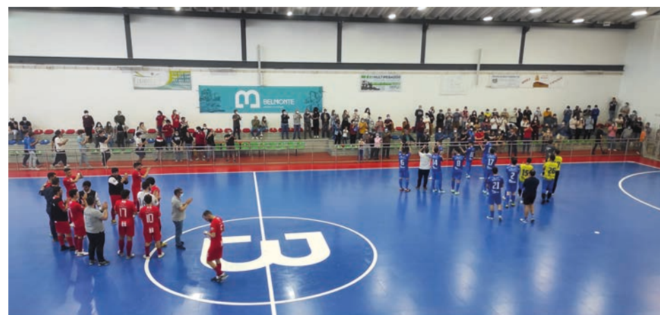
Perante o seu público, Cariense fez a festa no primeiro jogo da final do distrital de futsal

Costa continua sem perder qualquer ponto esta temporada e somou a 25ª vitória. O segundo embate está agendado para o próximo sábado (19h30) no Pavilhão Municipal de Idanha-a-Nova.