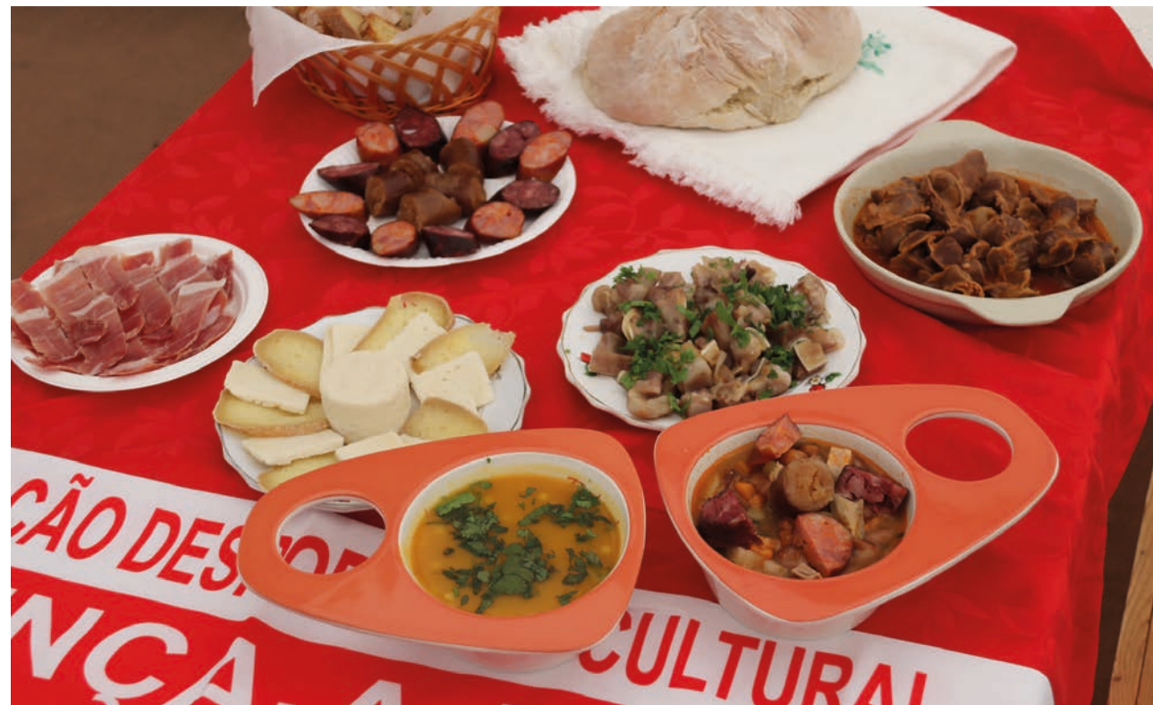
Mais de mil litros de sopa foram confeccionados no festival

No encerramento do Festival, o presidente da Câmara Municipal de Proença-a-Nova destacou o espírito de solidariedade demonstrado por todos quantos contribuíram para esta causa. “Evidentemente que este ano de 2022, que todos esperávamos em Janeiro que