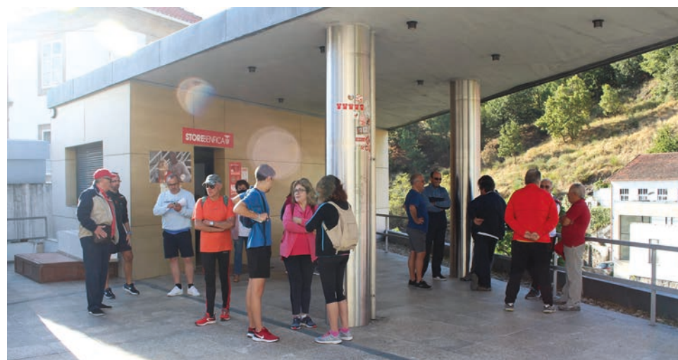
Casa do Benfica vai a votos no dia 7 de Maio

No dia 7, a colectividade vai a votos, entre as 16 e 19 horas. As candidaturas são aceites até às 18 horas desta sexta-feira, 22, sendo as candidaturas analisadas entre 26 e 29 deste mês.