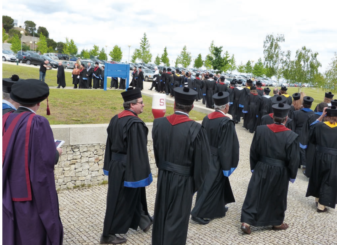
UBI assinala no dia 30 os seus 36 anos de existência