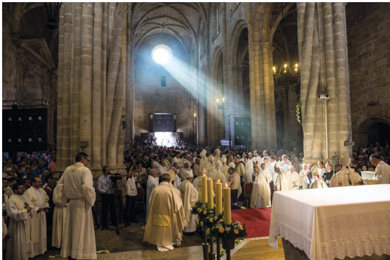
Bispo da Guarda diz que organização do trabalho está a gerar exclusão social